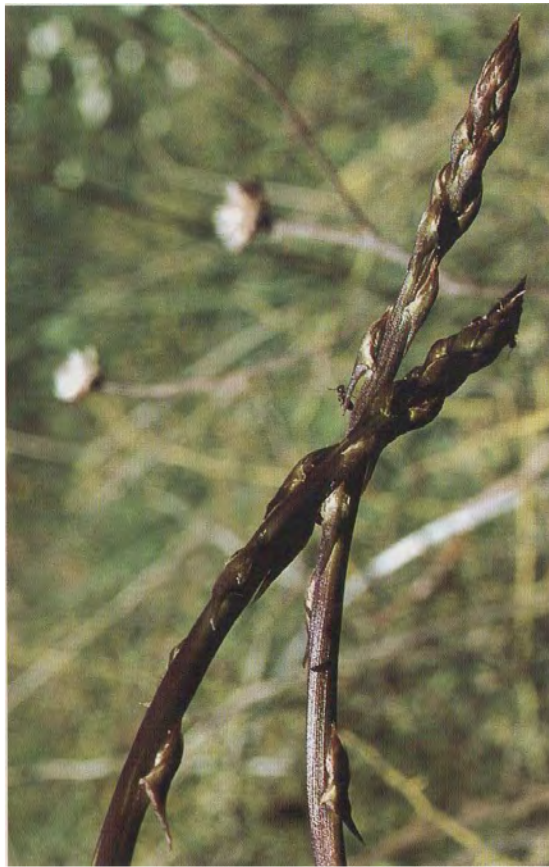
Asparagus aphyllus . Βλαστός (Αλιμπέρτης, 2006)

Είναι πόα πολυετής με βλαστό που φτάνει μέχρι 1 μέτρο κι έχει λεπτές αυλακώσεις. Είναι φυτό άφυλλο που, αντί για φύλλα, έχει μυτερά αγκαθωτά κλαδάκια και τα άνθη του, 2-8 στον αριθμό, είναι μικρά, κιτρινωπά πάνω σε ποδίσκο. Η άνθιση γίνεται στο τέλος της άνοιξης.