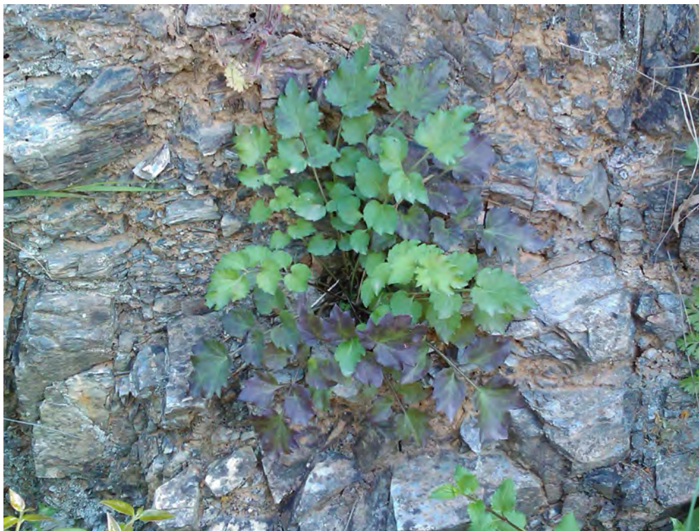
Petromarula pinnata . Ροζέτα (Πρωτότυπη εικόνα)

Πολυετής πόα με βλαστό όρθιο, ισχυρό, απλό ή πολύκλαδο από τη βάση. Παράρριζα φύλλα μακρόμισχα, πτεροσχιδή, τα επάκρια λογχοειδή ή καρδιοειδή και τα πλάγια δρεπανοειδώς κυρτά, οδοντωτά. Τα άνθη κατά επιμήκης βότρυς ανά 2 με 5 επί κοινού ποδίσκου από την μασχάλη χρώματος γαλάζιο. Η άνθιση γίνεται από τον Απρίλιο έως τον Ιούνιο.