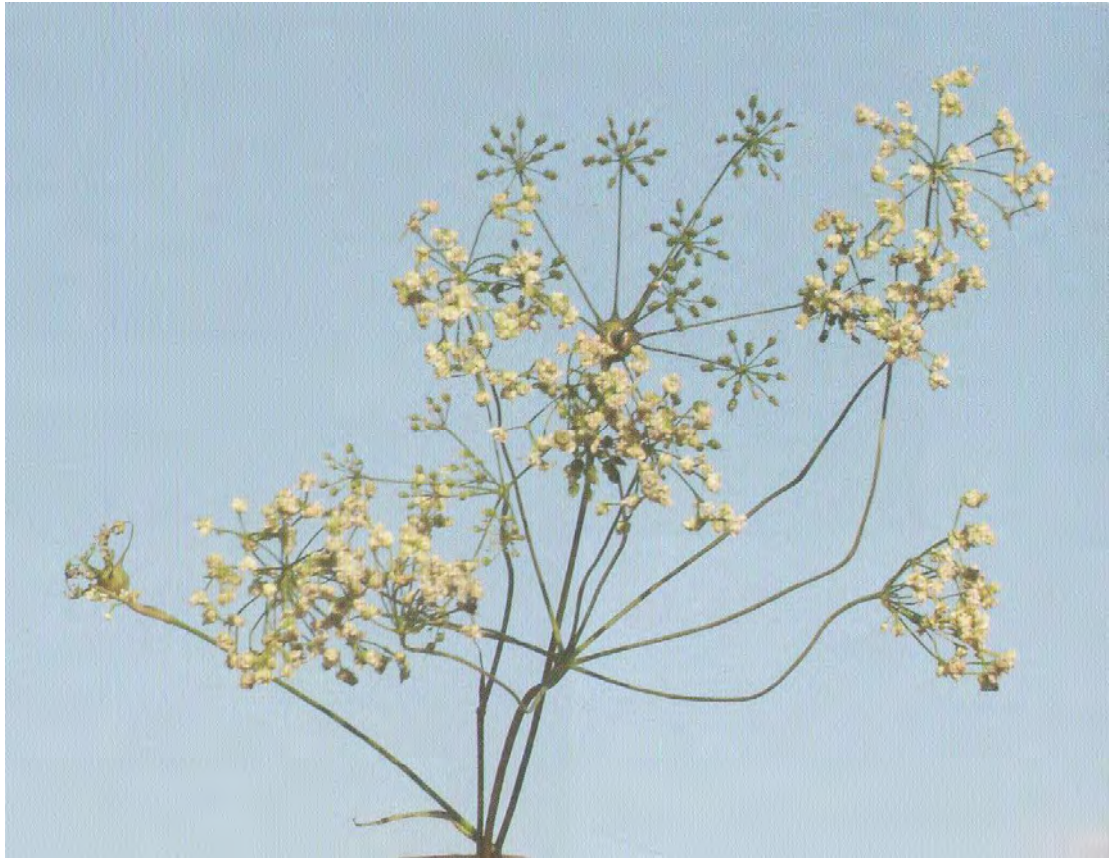
Scaligeria pariformis . Βλαστός (Σταυριδάκης, 2006)