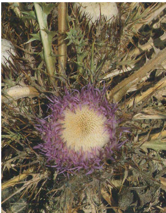
Atractylis gummifera . Άνθη (Πρωτότυπη εικόνα)