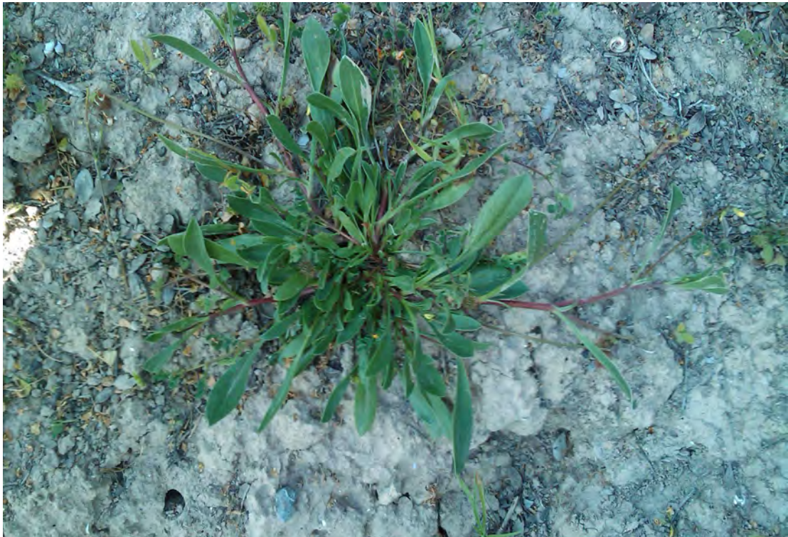
Scorpiurus muricatus. Ροζέτα (Πρωτότυπη εικόνα)

Είναι πόα μονοετής με βλαστό έρπων ή ανιών. Τα φύλλα του είναι λογχοειδή, στενούμενα στη βάση με μακρύ μίσχο και τα άνθη του είναι κίτρινα. Η άνθιση γίνεται από το Μάρτιο έως το Μάιο.