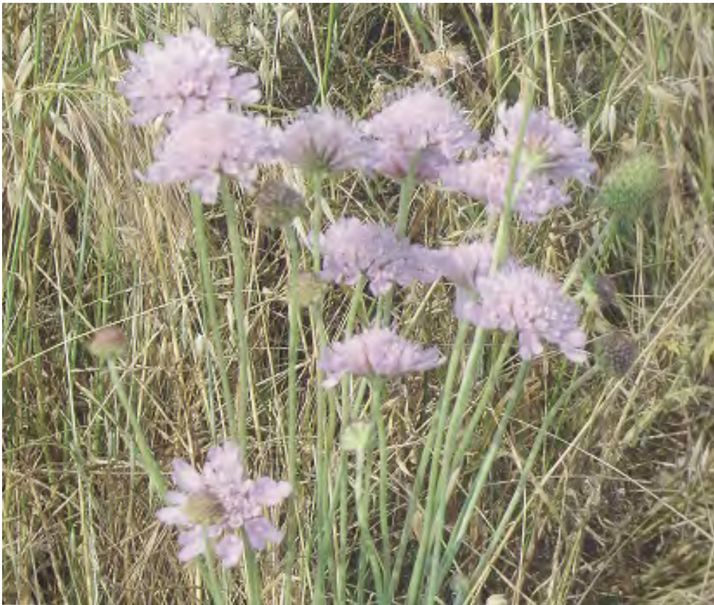
Scariosa atropurpurea . Άνθη (Σταυριδάκης, 2006)