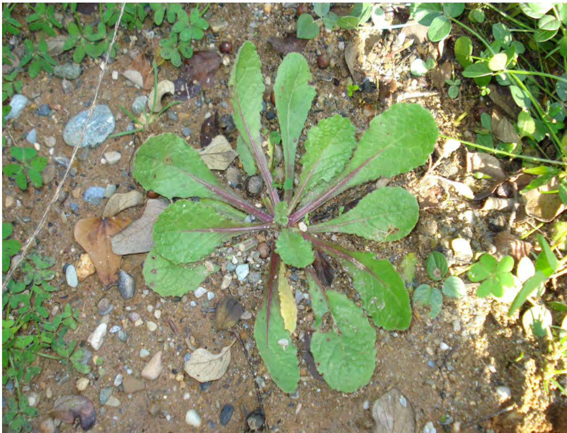
Urospermum picroides . Ροζέτα (Πρωτότυπη εικόνα)

Είναι πόα μονοετής με βλαστό όρθιο, διακλαδισμένο. Τα φύλλα είναι χνουδωτά, τα κατώτερα προμήκη, πτερόβολα ή ανίσως οδοντωτά και τα ανώτερα λογχοειδή με ωτία οξύληκτα. Τα άνθη είναι κίτρινα. Η άνθιση γίνεται από το Μάρτιο έως το Μάιο.