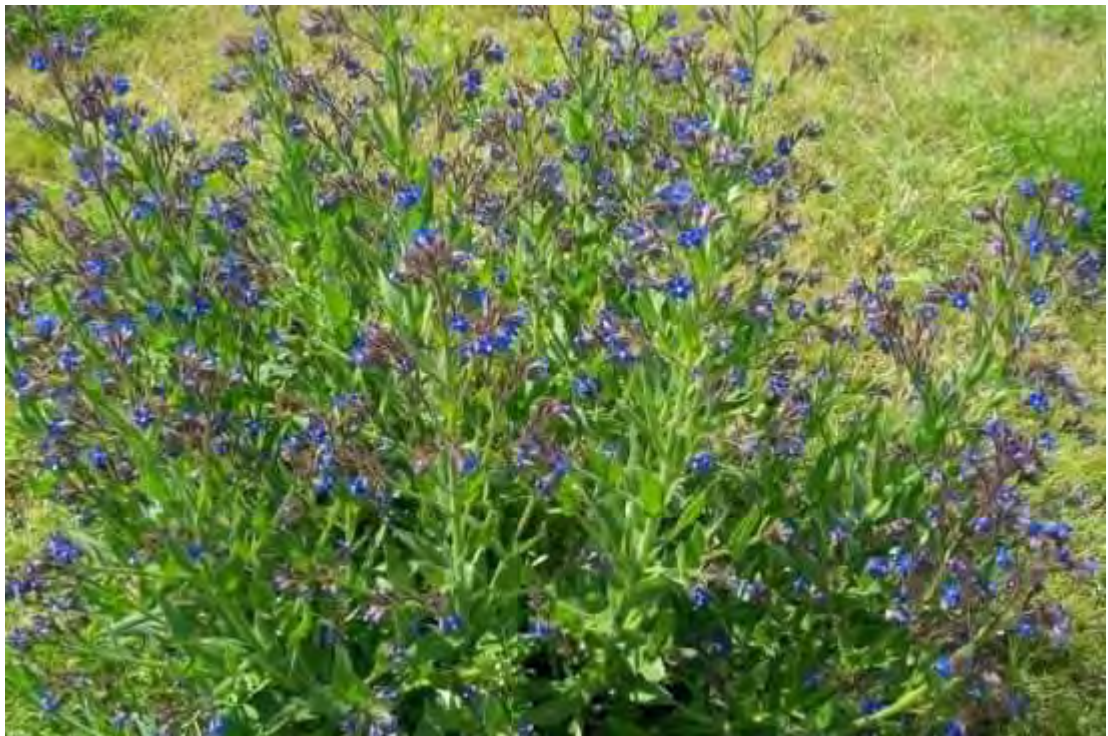
Anchusa azurea . Άνθη