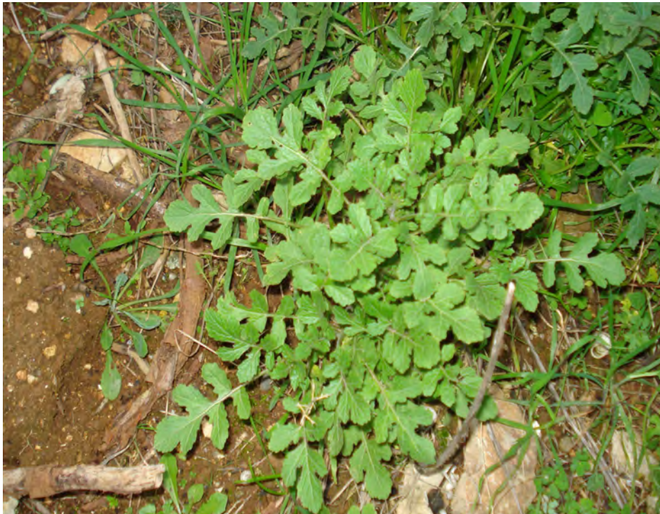
Sinapis alba. Ροζέτα (Πρωτότυπη εικόνα)

Είναι πόα μονοετής με βλαστό όρθιο, απλό ή διακλαδισμένο, τριχωτό. Τα φύλλα είναι οδοντωτά και τα άνθη είναι κίτρινα. Η άνθιση γίνεται από το Δεκέμβριο έως το Μάιο.