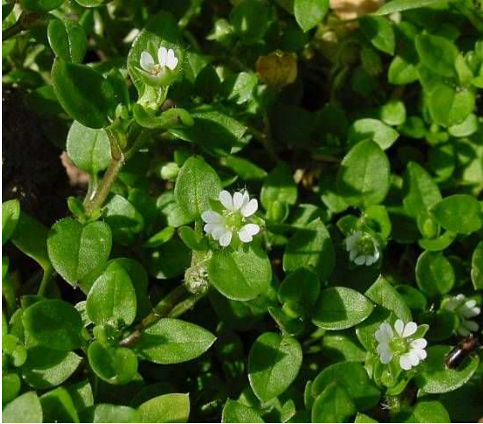
Stellaria media . Βλαστοί με ανθάκια ( http://senshumus.wordpress.com )