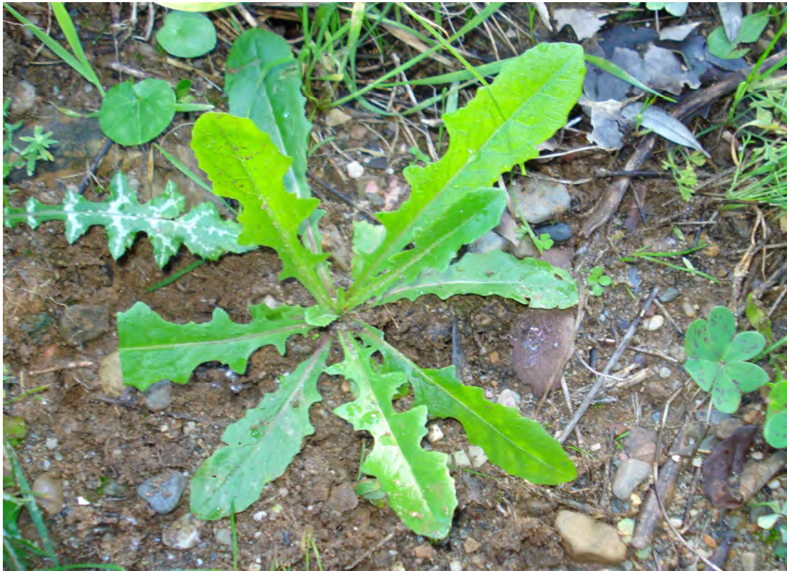
Cichorium intybus. Ροζέτα (Πρωτότυπη εικόνα)

Είναι πόα πολυετής με βλαστό ελαφρά τριχωτό ή λείο. Τα φύλλα του είναι μεγάλα, λοβωτά ή οδοντωτά και τα άνθη του είναι μπλε. Η άνθιση γίνεται από το Μάιο έως τον Ιούνιο.