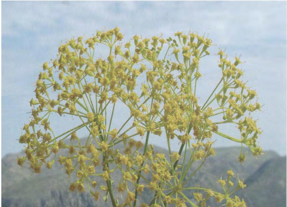
Oenothera pimpinelloides . Άνθος (Σταυριδάκης, 2006)