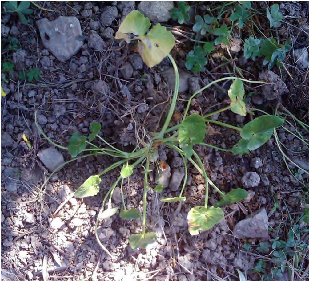
Ranunculus ficariiformis. Ροζέτα (Πρωτότυπη εικόνα)

Είναι πολυετές φυτό, χαμωτό, λείο με φύλλα ελαφρά σαρκώδη, σκουροπράσινα, φαρδιά, ωοειδή στη βάση, καρδιοειδή και τα άνθη είναι κίτρινα. Η άνθιση γίνεται από το Μάρτιο έως το Μάιο.