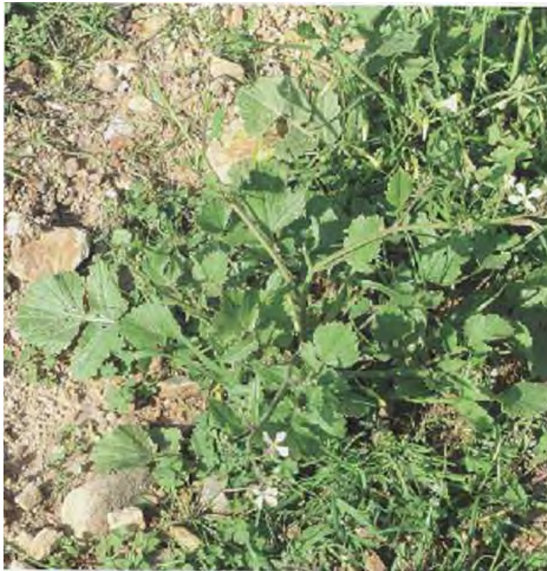
Raphanus raphanistrum . Ροζέτα (Σταυριδάκης, 2006)

Είναι πόα μονοετής ή πολυετής με βλαστό διακλαδισμένο. Τα κατώτερα φύλλα είναι λυροειδή και τα ανώτερα οδοντωτά. Τα άνθη είναι κίτρινα, ενίοτε λευκωπά. Η άνθιση γίνεται από το Μάρτιο έως το Μάιο.