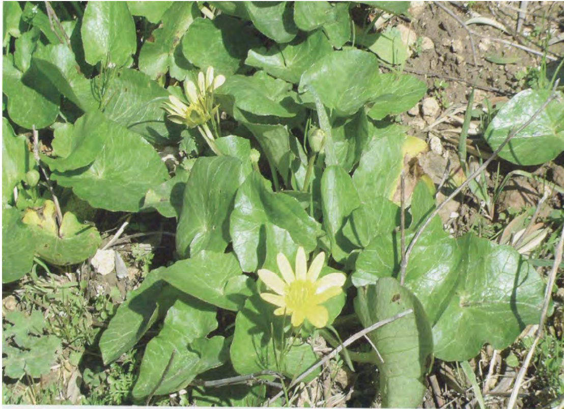
Ranunculus ficariiformis . Βλαστός με φύλλα και άνθος (Πρωτότυπη εικόνα)