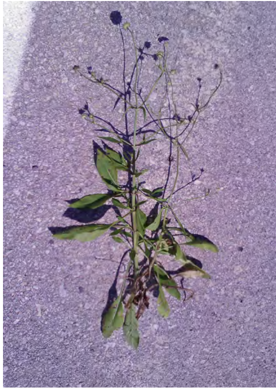
Scariosa atropurpurea . Βλαστός (Πρωτότυπη εικόνα)