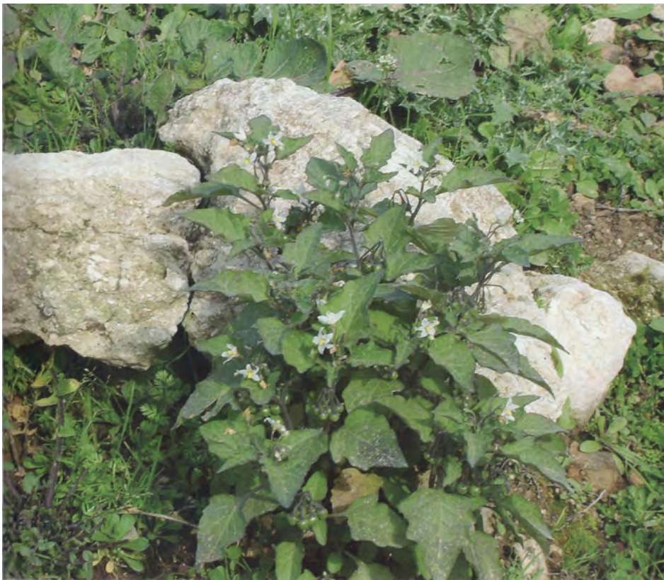
Solanum nigrum. Ροζέτα (Σταυριδάκης, 2006)

Είναι πόα μονοετής με βλαστούς και διακλαδώσεις όρθιους ή διάχυτους γωνιώδεις, αραιώς τριχωτούς. Τα φύλλα είναι βαθυπράσινα, κυματιστά, ωοειδή, τα άνθη είναι μικρά, λευκά με κίτρινους ανθήρες κι ο καρπός ράγα μαύρη. Η άνθισή του γίνεται το καλοκαίρι.