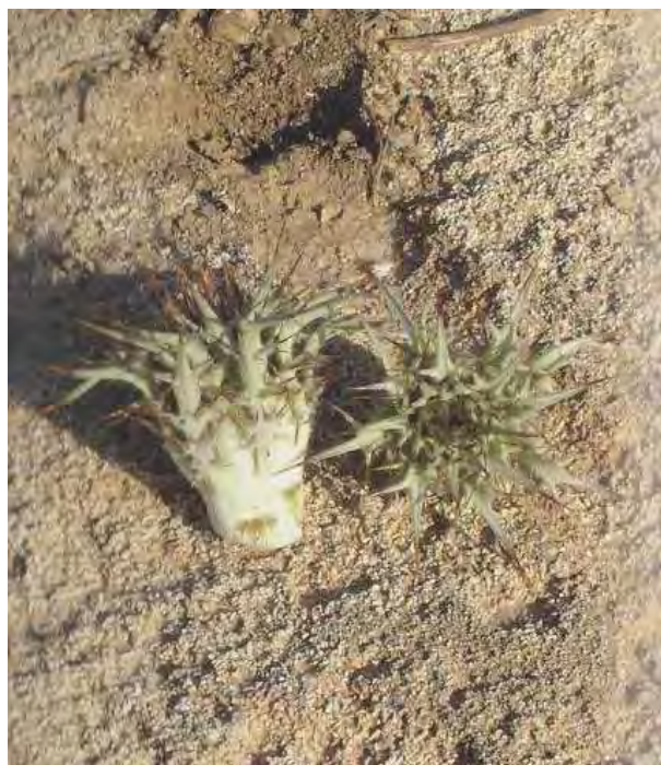
Atractylis gummifera . Βλαστός (Σταυριδάκης, 2006)