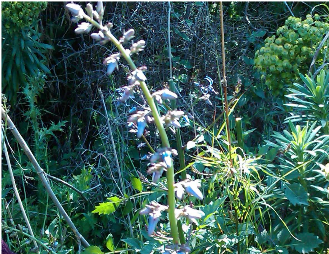
Petromarula pinnata . Άνθη (Πρωτότυπη εικόνα)