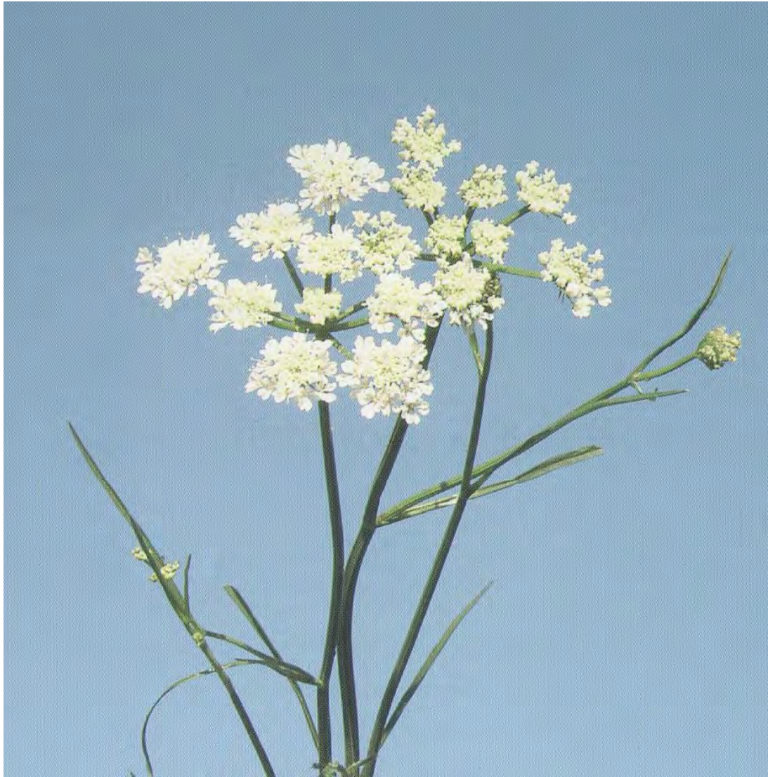
Kudmania sicula . Βλαστός με άνθος (Σταυριδάκης, 2006)