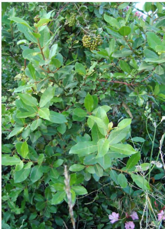
Laurus nobilis (Πρωτότυπη εικόνα)

Είναι αειθαλές δέντρο, αρωματικό, ύψους 2 – 6 μέτρα. Τα φύλλα είναι λογχοειδή, μυτερά, σκούρα πράσινα από κάτω κι από πάνω ανοιχτόχρωμα. Τα άνθη είναι κίτρινα κι ο καρπός μαύρος. Η άνθιση γίνεται από το Μάιο έως τον Ιούνιο.