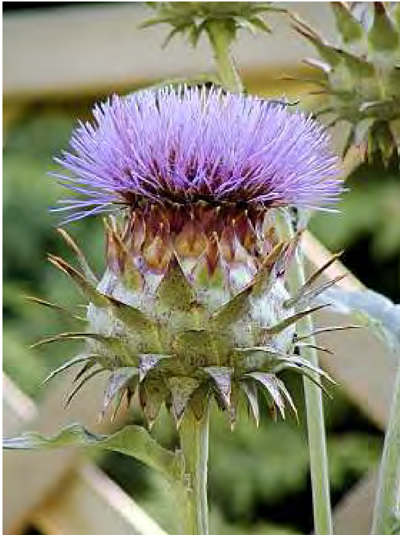
Cynara cornigera . Καρπός (Πρωτότυπη εικόνα)

προσθέσουμε στα τσιγαριστά χόρτα και να την μαγειρέψουμε με κρέας. Είναι νόστιμη και γευστική. (Προφορική μαρτυρία)