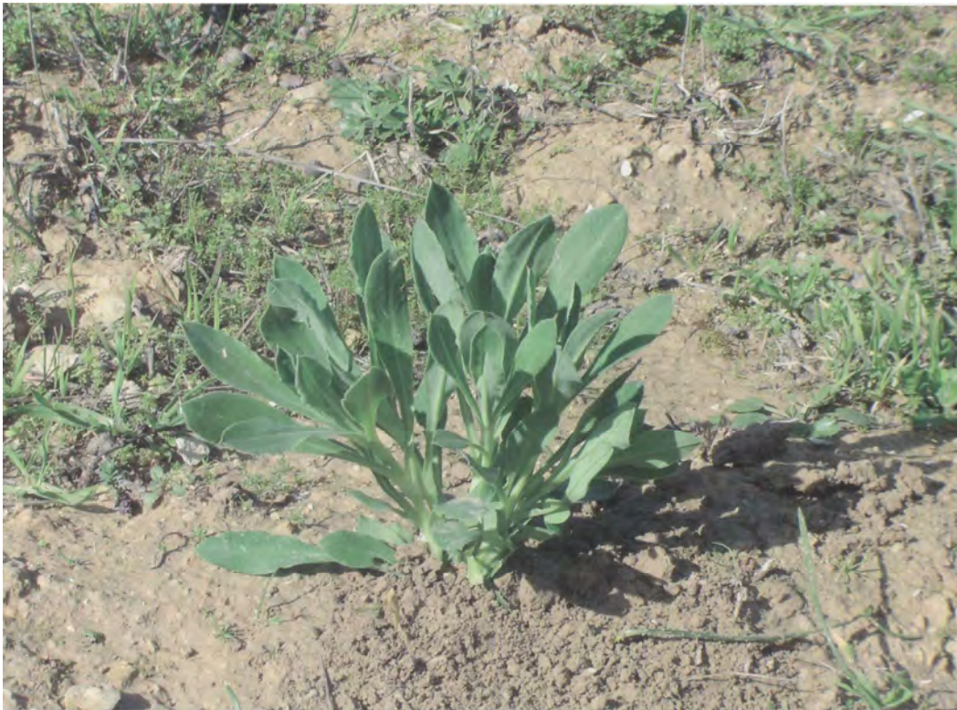
Silene vulgaris . Ροζέτα (Σταυριδάκης, 2006)

Είναι πόα μεγάλη, πολυετής με βλαστό όρθιο, λείο. Τα φύλλα της είναι λογχοειδή και τα άνθη της είναι λευκά, ρόδινα ή πρασινωπά. Η άνθιση γίνεται από τον Απρίλιο έως το Μάιο.