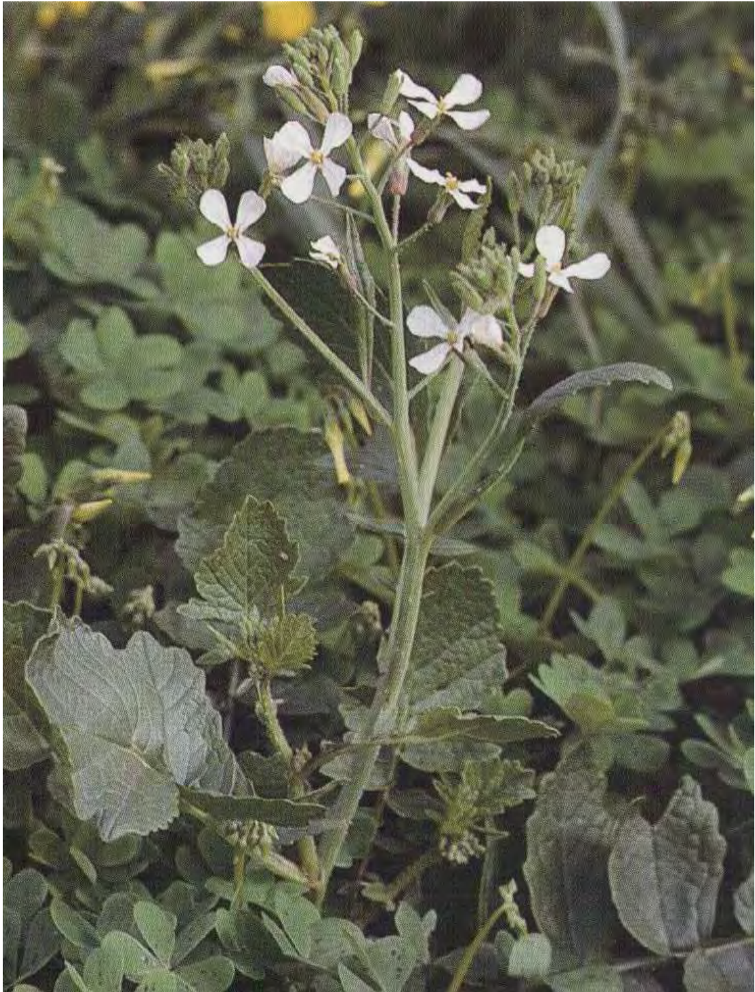
Raphanus raphanistrum . Βλαστός με άνθη (Αλιμπέρτης, 2006)