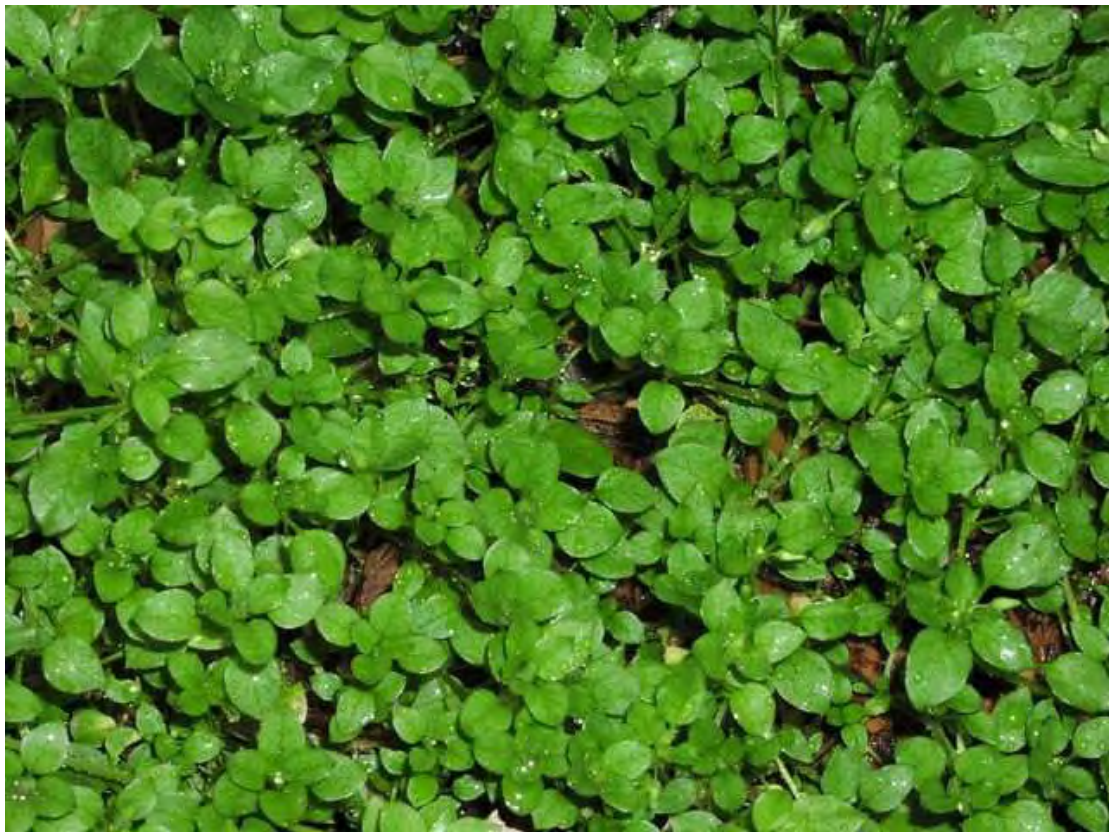
Stellaria media . Ροζέτα (Πρωτότυπη εικόνα)

Είναι πόα μονοετής ή πολυετής, χνουδωτή ή λεία με βλαστούς στρογγυλούς. Τα φύλλα είναι ωοειδή, οξέα, τα κατώτερα μακρώς έμμισχα. Τα άνθη είναι κατά μασχαλιαία έμφυλλα, αραιά κύματα χρώματος λευκού. Η άνθιση γίνεται από το Δεκέμβριο έως τον Απρίλιο.