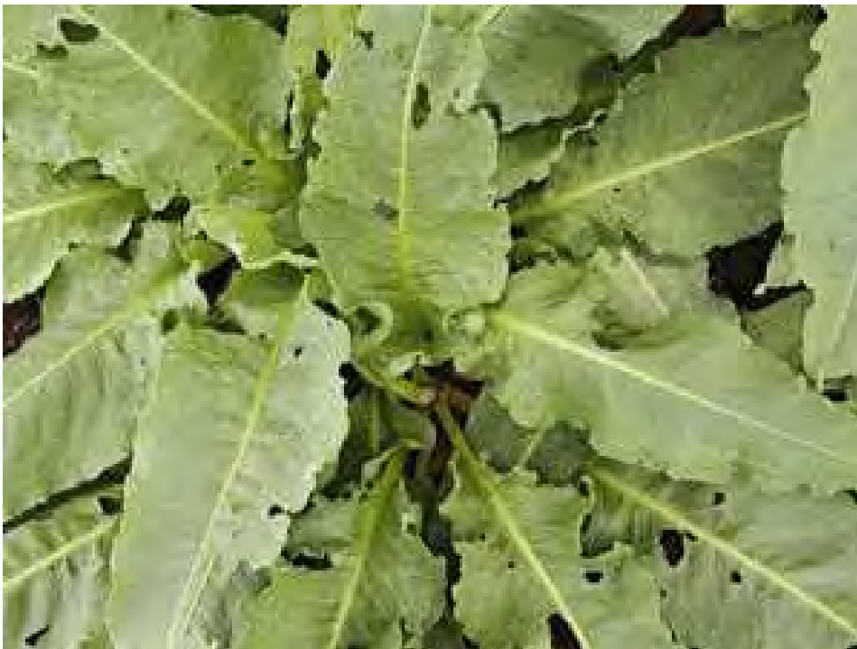
Rumex spp. Ροζέτα (Πρωτότυπη εικόνα)

Είναι πόα πολυετής με βλαστό όρθιο, διακλαδισμένο. Τα φύλλα του είναι λογχοειδή, βελονοειδή, τα άνθη του είναι ασήμαντα σε κόμπους, πρασινωπά ή κοκκινωπά στις άκρες και οι καρποί ωοειδής, πολυάριθμοι. Η άνθισή του γίνεται από τον Απρίλιο έως το Μάιο.