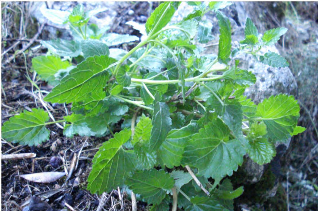
Pasium majus . (Πρωτότυπη εικόνα)

Είναι θάμνος ξυλώδης μέχρι 1 μέτρο ύψος, με ακανόνιστες διακλαδώσεις. Τα φύλλα είναι έμμισχα, ωοειδή, λογχοειδή, με βάση καρδιώδη και τα άνθη είναι λευκά. Η άνθιση γίνεται από τον Απρίλιο έως το Μάιο.