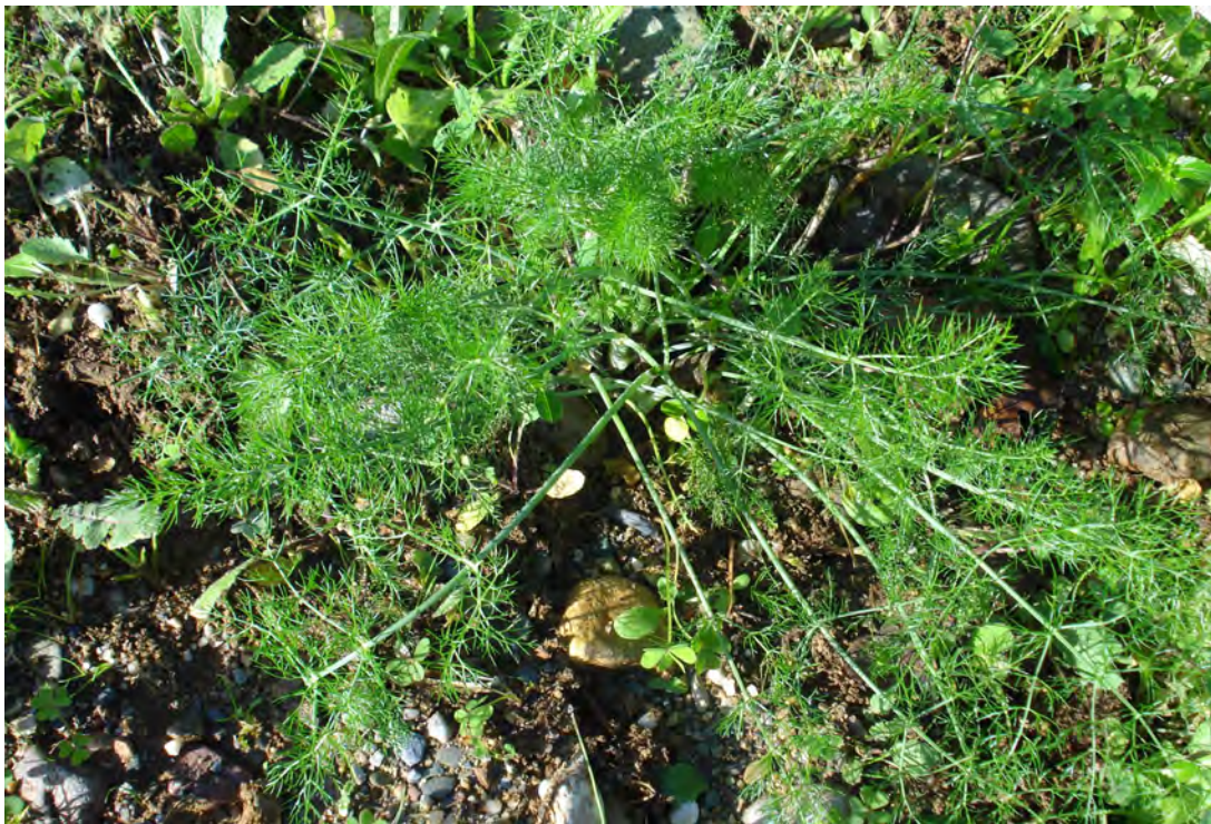
Foeniculum vulgare. Ροζέτα (Πρωτότυπη εικόνα)

Είναι πόα διετής ή πολυετής με βλαστό όρθιο, ισχυρό, γραμμωτό, πολύκλαδο και λείο αρωματικό μέχρι 2 μέτρα ύψος. Τα φύλλα είναι πτεροσχιδή, τα άνθη είναι κίτρινα και ο καρπός του έχει μήκος 4-8 χιλιοστά. Η άνθιση γίνεται από τον Ιούνιο έως τον Αύγουστο.