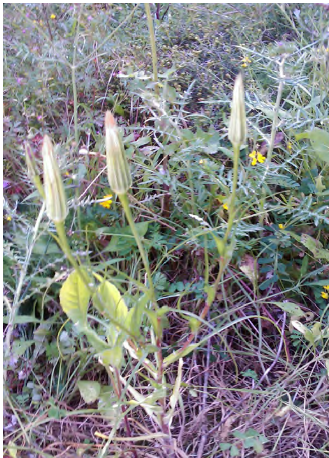
Tragopogon sinuatus . Βλαστός (Πρωτότυπη εικόνα)

Είναι πόα διετής, το ύψος του φτάνει μέχρι 1,20 μέτρα. Τα φύλλα του είναι γραμμοειδή, πλατύτερα στη βάση, φέρονται πάνω σε απλούς βλαστούς και τα άνθη είναι ρόδινα ή βιολετί. Η άνθιση γίνεται από τον Απρίλιο έως το Μάιο.