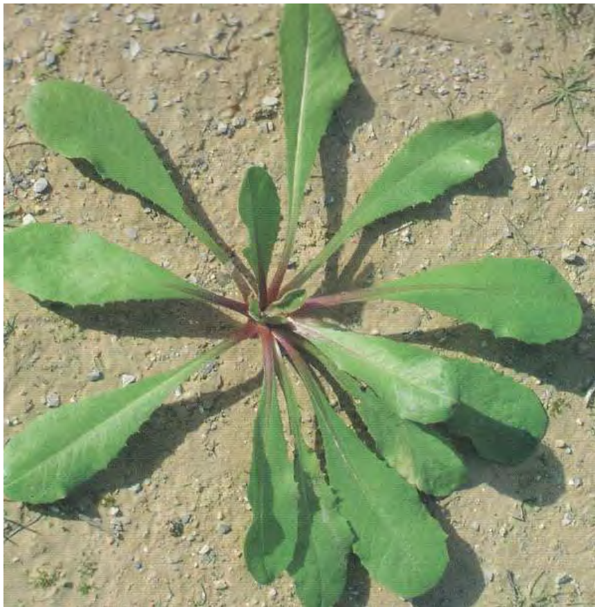
Crepis vesicaria. Ροζέτα (Πρωτότυπη εικόνα)

Είναι πόα μονοετής με βλαστό όρθιο, ύψους 10-50 εκατοστών, διακλαδισμένο. Τα κατώτερα φύλλα είναι έμμισχα, προμήκη, σπαθοειδή, οδοντωτά ή πτερόβολα και τα ανώτερα είναι επιφυή, λογχοειδή. Τα άνθη είναι κίτρινα. Η άνθιση γίνεται από το Μάρτιο έως το Μάιο.