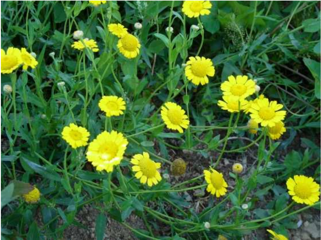
Chrysanthemum segetum . Βλαστός και άνθη