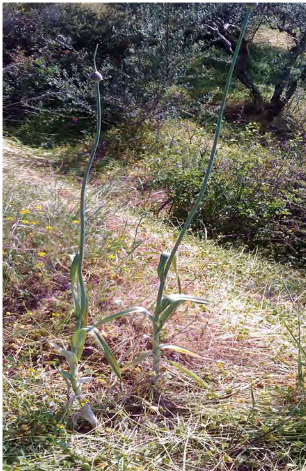
Allium ampeloprasum. Βλαστός (Πρωτότυπη εικόνα)

Είναι πόα πολυετής με βολβό και βλαστό όρθιο, λείο. Τα φύλλα του είναι αυλακόμορφα, επιμήκη και τα άνθη του βιολετί. Η άνθισή του γίνεται από το Μάιο έως τον Ιούνιο.