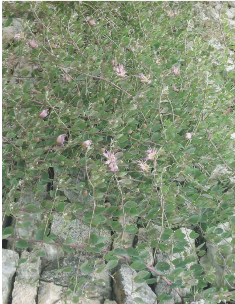
Capparis spinosa . Βλαστός (Σταυριδάκης, 2006)