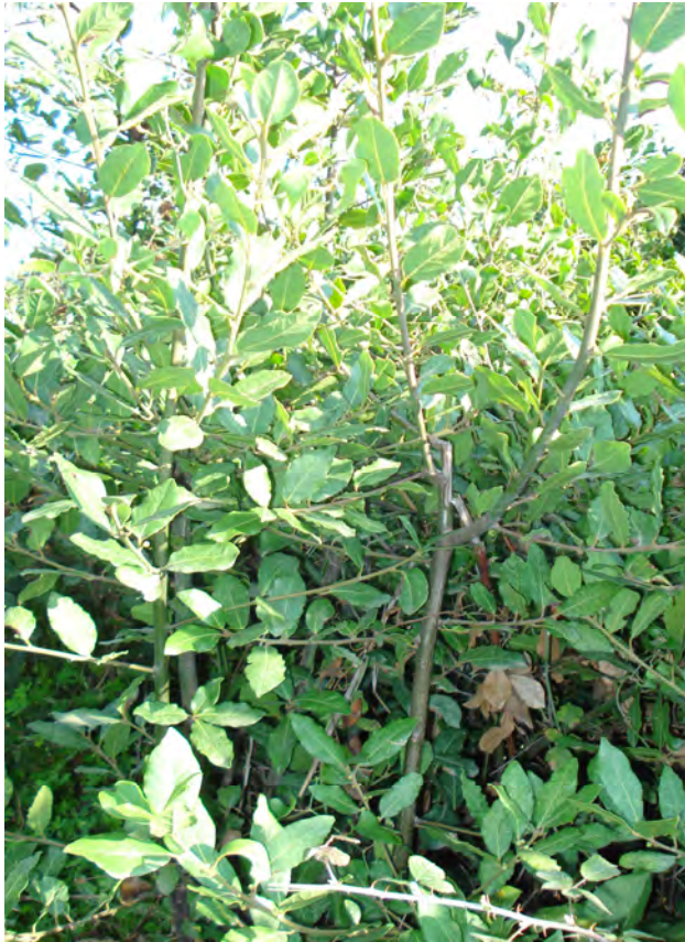
Laurus nobilis βλαστός (Πρωτότυπη εικόνα)