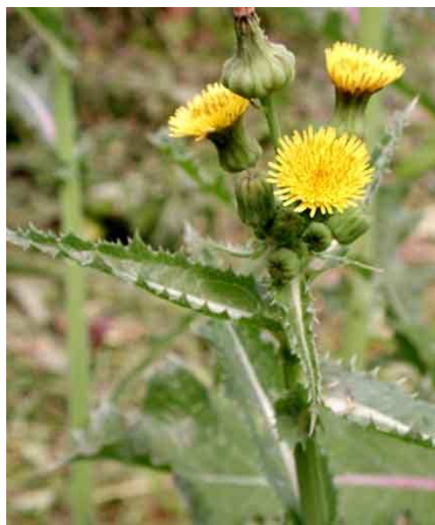
Sonchus asper. Άνθη