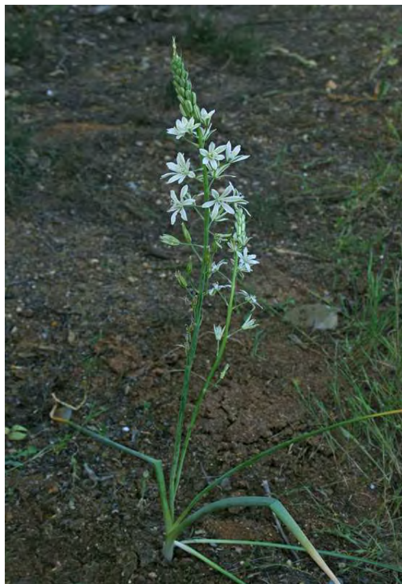
Ornithogalum narbonense . Βλαστός (Πρωτότυπες εικόνες)

Το συναντάμε σε χέρσους αγρούς, στις άκρες χωραφιών της πεδινής, ημιορεινής κι ορεινής ζώνης. Καταναλώνεται από το Μάρτιο έως τον Απρίλιο. Από αυτόν τρώμε το βολβό του, αφού πρώτα το βράσουμε και το αφήσουμε πολλές μέρες μέσα σε νερό έτσι ώστε να γλυκάνει η γεύση του. Μετά μπαίνει στο ξύδι και τρώγεται ως τουρσί. Επίσης, τρώγεται και το βλαστάκι* του τσιγαριστό, σε πίτες και καλιτσούνια*, αλλά όχι σε μεγάλη ποσότητα λόγω της πικρής γεύσης του. Συνδυάζεται με άλλα χόρτα εποχής και θεωρείται υγιεινό και τονωτικό. (Προφορική μαρτυρία)