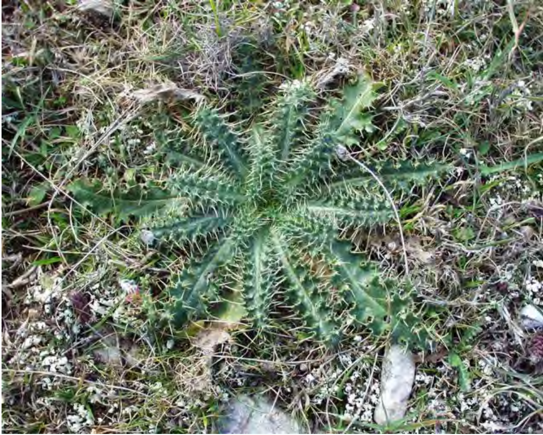
Scolymus hispanicus . Ροζέτα (Πρωτότυπη εικόνα)