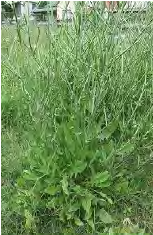
Cichorium intybus . Βλαστός