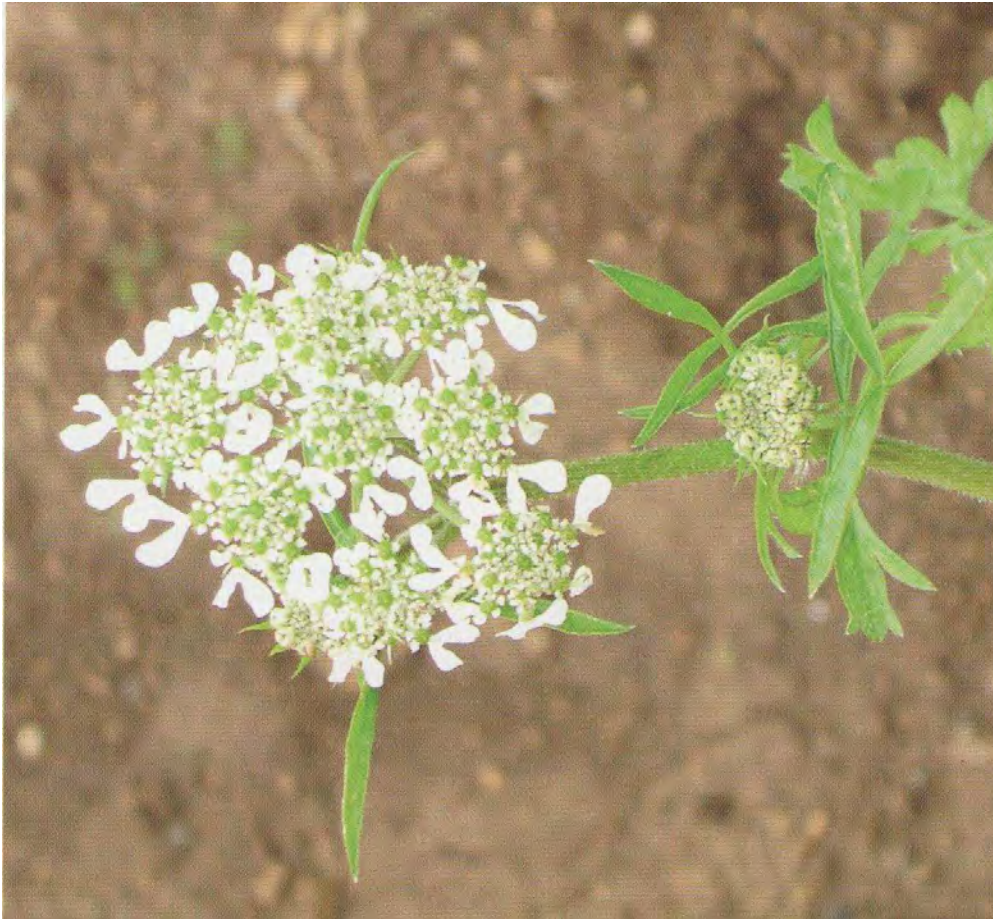
Tor-dylium aru-lum . Βλαστός με άνθος (Σταυριδάκης, 2006)