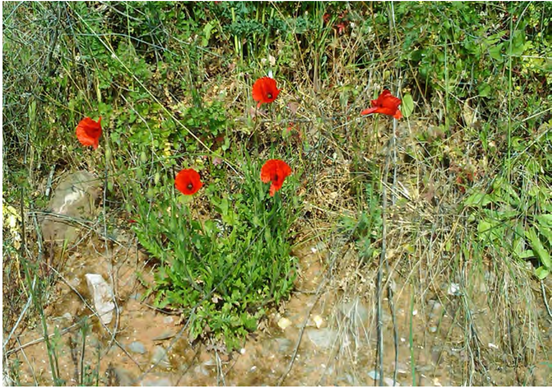
Papaver rhoeas . Βλαστός (Πρωτότυπη εικόνα)