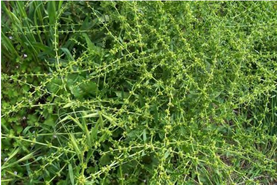
Rumex pulcher. Βλαστός

( http://floraitaliana.blogspot.com/2008/04/rumex-pulcher.html )