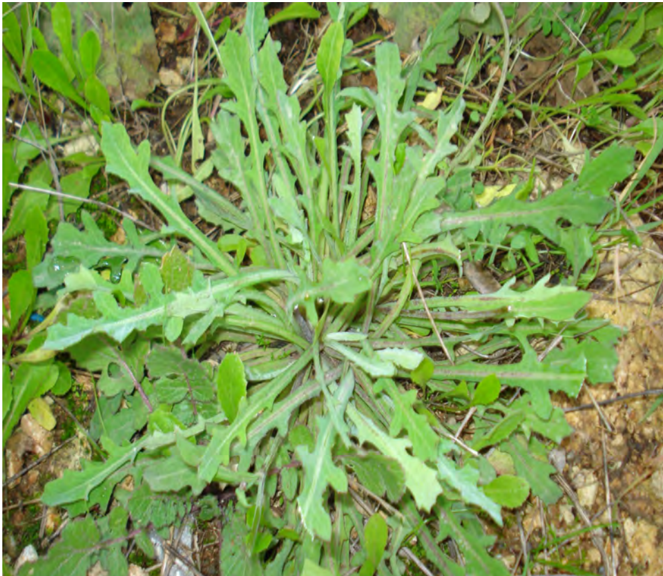
Reihardia picroides . Ροζέτα (Πρωτότυπη εικόνα)

Είναι μονοετής ή πολυετής πόα με γαλακτώδη χυμό. Τα φύλλα είναι οδοντωτά ή πτερόβολα και τα άνθη είναι κίτρινα. Η άνθιση γίνεται από το Μάρτιο έως το Μάιο.