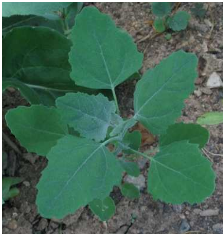
Chenopodium album. Ροζέτα

Είναι πόα μονοετής με μεγάλο βλαστό, όρθιο, ραβδωτό με διακλαδώσεις απλωτές από τη βάση. Τα φύλλα είναι λογχοειδή ή ρομβοειδή, οδοντωτά, έμμισχα με όψη αλευρώδη. Τα άνθη είναι ασήμαντα, πρασινωπά με ακραίους στάχεις. Η άνθιση είναι από τον Ιούνιο έως τον Αύγουστο.