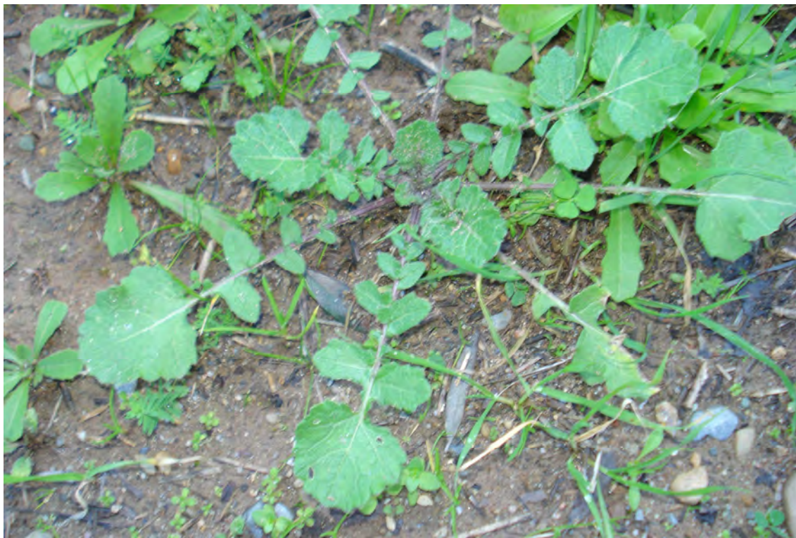
Hirschfeldia incana . Ροζέτα (Πρωτότυπη εικόνα)

Είναι πόα διетής, πολύκλαδη, τριχωτή, λευκή. Τα κατώτερα φύλλα είναι λυροειδή, πτεροσχιδή και τα ανώτερα είναι λογχοειδή, γραμμοειδή, ακέραια. Τα άνθη είναι ωχροκίτρινα. Η άνθιση γίνεται από το Μάρτιο έως το Μάιο.