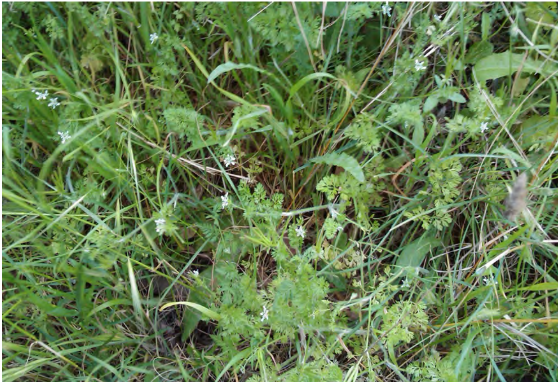
Scandix pecten veneris . Ροζέτα (Πρωτότυπη εικόνα)

Είναι πόα μονοετής με βλαστό χνουδωτό, τραχύ, γραμμωτό κατά μήκος με διακλαδώσεις. Τα φύλλα είναι πτεροσχιδή και τα άνθη είναι λευκά. Η άνθιση γίνεται από τον Απρίλιο έως το Μάιο.