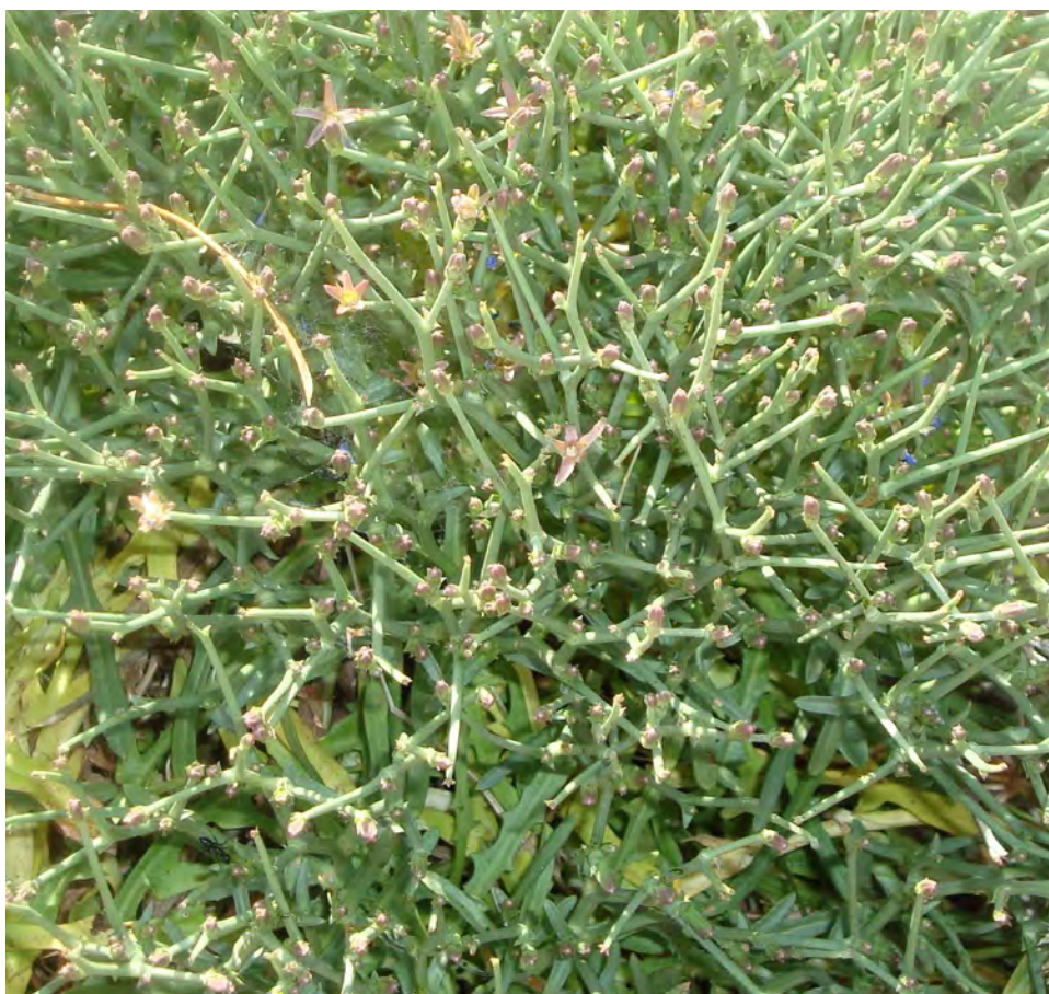
Cichorium spinosum . Βλαστός (Πρωτότυπη εικόνα)