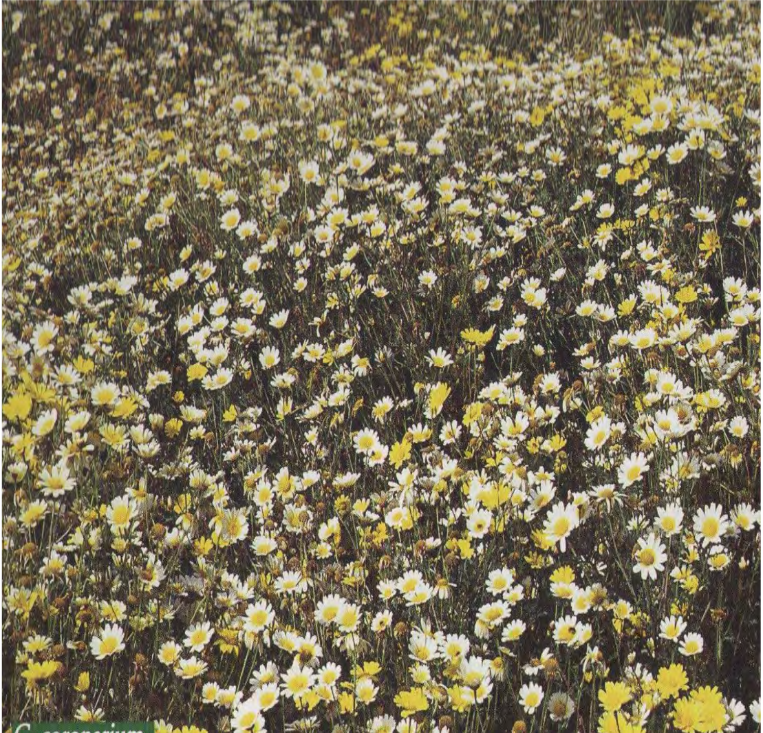
( Πρωτότυπη εικόνα )

Με βάση όλα τα παραπάνω στόχος της εργασίας αυτής είναι να γίνει καταγραφή των άγριων βρώσιμων φυτών στο Νομό Χανίων της Κρήτης, που υπήρχαν από την αρχαιότητα μέχρι και σήμερα.