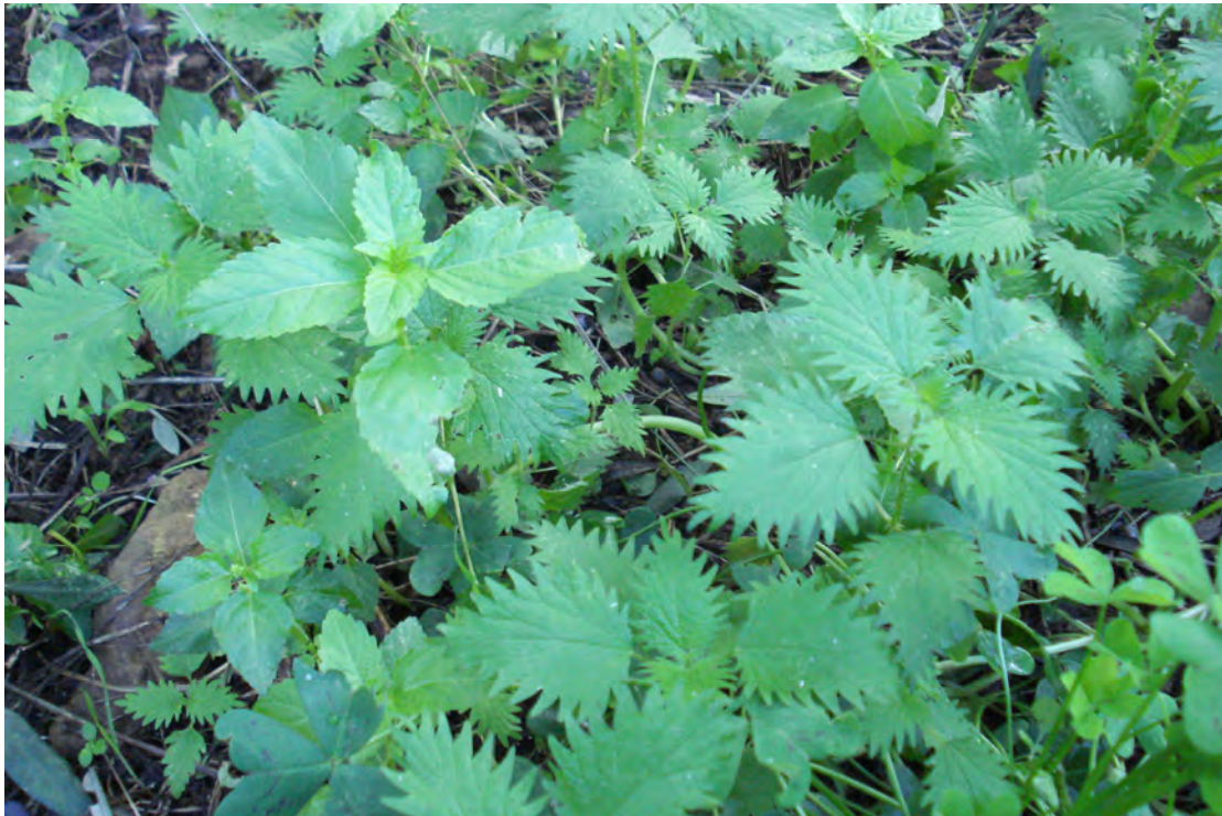
Urtica pilulifera . Ροζέτα (Πρωτότυπη εικόνα)

Είναι πόα μονοετής με βλαστό όρθιο, διακλαδισμένο, συνήθως, στη βάση, αδρότριχο, ανοιχτοπράσινο. Τα φύλλα είναι μικρά, καρδιοειδή, χνουδωτά, βαθέως οδοντωτά με αγκάθια. Ταξιανθία με αρσενικά και θηλυκά άνθη. Χαρακτηρίζεται από τις κνηστικές τρίχες που υπάρχουν σε ολόκληρο το φυτό. Οι τρίχες αυτές είναι επιμήκεις με οξύ άκρο το οποίο καταλήγει σ'ένα εύθραυστο σφαιρίδιο, γεμάτο με ουσίες που προκαλούν κνησμό. Η άνθιση γίνεται την άνοιξη.