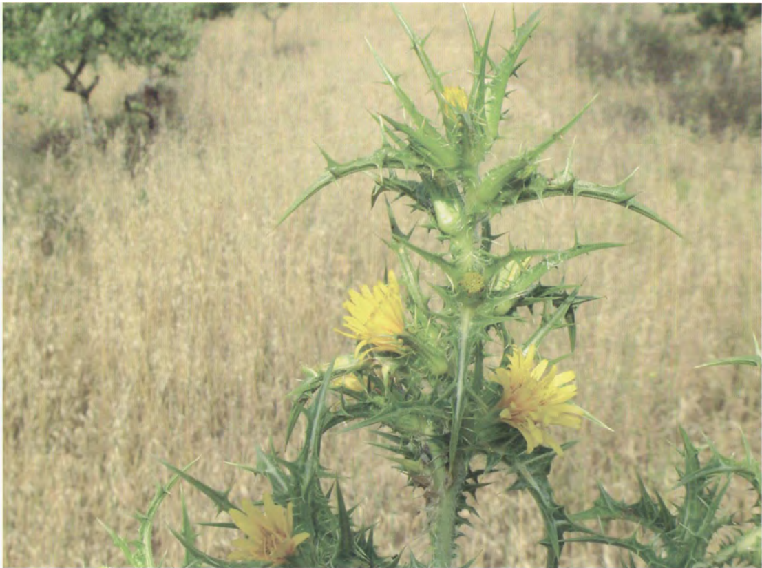
Scolymus hispanicus . Βλαστός με άνθη (Σταυριδάκης, 2006)