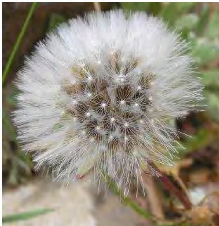
Urospermum picroides. Ξεπούλιασμα άνθους ( http://www.floradecanarias.com/urospermum_picroides.html )