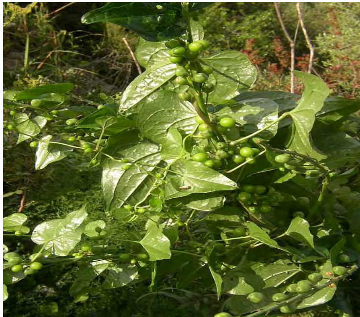
Tamus communis . Καρπός (Πρωτότυπη εικόνα)