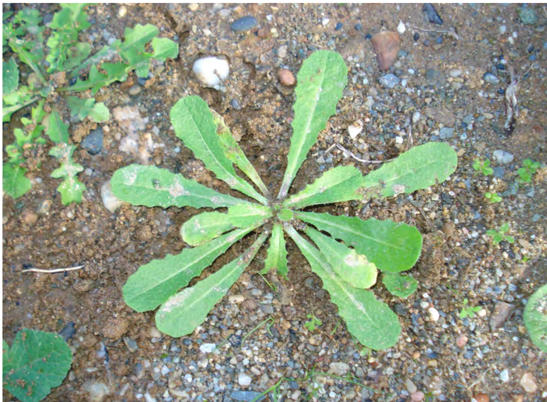
Helminthotheca echioides . Ροζέτα (Πρωτότυπη εικόνα)

Είναι μονοετής πόα με βλαστό ύψους μέχρι 1 μέτρο όρθιο, διακλαδισμένο. Τα φύλλα της είναι τραχιά, αδρότριχα, τριχωτά τα κατώτερα κυματοειδή, στενούμενα προς το μίσχο και τα ανώτερα καρδιοειδή, επιφυή, περίβλαστα. Τα άνθη είναι ανοιχτοκίτρινα. Η άνθιση γίνεται από το Μάρτιο έως το Μάιο.