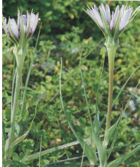
Tragopogon sinuatus. Βλαστός (Πρωτότυπη εικόνα)