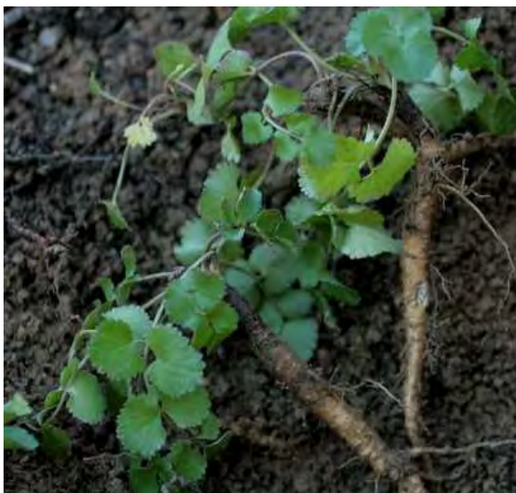
Pimpinella peregrina . Ροζέτα (Πρωτότυπη εικόνα)