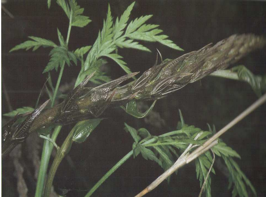
Tamus communis . Βλαστός (Αλιμπέρτης, 2006)

βραστεί ο βλαστός και προστεθεί στο ζωμό αυτό λεμόνι, γίνεται κόκκινος κι, όταν καταναλωθεί, ανακουφίζει τους πόνους του στομάχου. (Προφορική μαρτυρία)