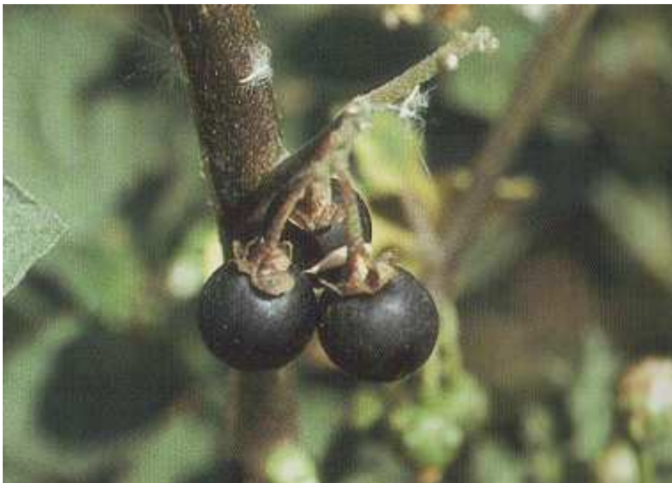
Solanum nigrum . Καρπός (Αλιμπέρτης, 2006)