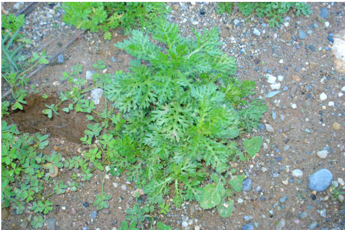
Chrysanthemum segetum . Ροζέτα (Πρωτότυπη εικόνα)

Είναι πόα μονοετής, ο βλαστός είναι όρθιος, ολιγόκλαδος, λείος και δεν υπερβαίνει τα 50εκ. Τα κατώτερα φύλλα είναι οδοντωτά, σχεδόν πτεροσχιδή και τα υπόλοιπα λογχοειδή. Έχει κεφάλια μεγάλα μονήρη με περίβλημα λογχοειδές. Ανθίδια με γλωσσίδιο έχουν χρώμα χρυσοκίτρινο. Η άνθισή της γίνεται από τον Απρίλιο έως τον Ιούνιο.