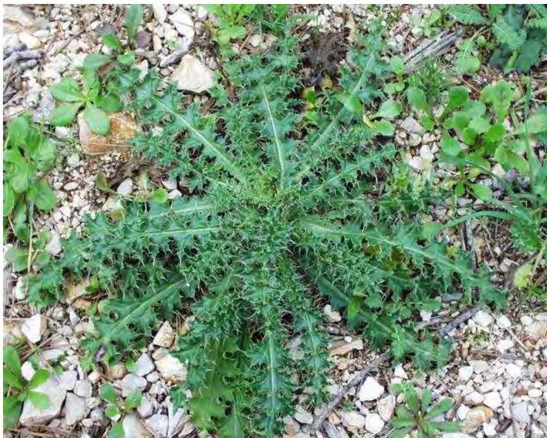
Scolymus hispanicus. Ροζέτα (Πρωτότυπη εικόνα)

Είναι πόα διετής ή πολυετής με βλαστό όρθιο, συνήθως χνουδωτό με πτερύγια διακοπτόμενα. Τα φύλλα είναι πτεροβόλα αγκαθωτά. Έχει κεφάλια μονήρη μασχαλιαία και άνθη κίτρινα. Η άνθιση γίνεται από το Μάρτιο έως το Μάιο.