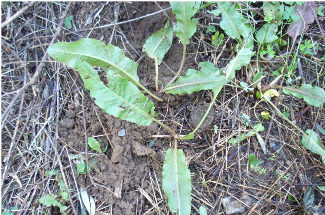
Rumex puleher. Ροζέτα (Πρωτότυπη εικόνα)

Είναι πόα πολυετής με βλαστό όρθιο κι έχει διακλαδώσεις απλωτές. Τα φύλλα του είναι λογχοειδή, στρογγυλά ή καρδιοειδή στη βάση και τα άνθη είναι ασήμαντα σε κόμπους, πρασινωπά. Η άνθισή του γίνεται από τον Απρίλιο έως το Μάιο.