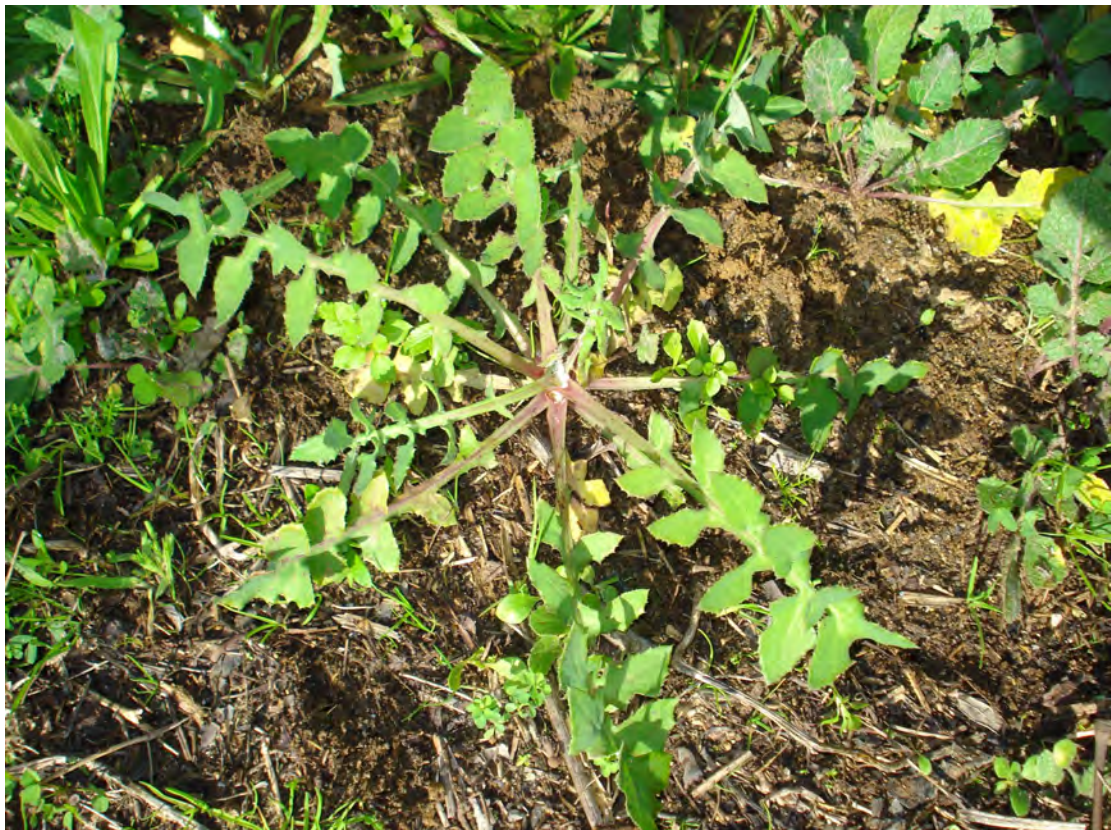
Sonchus oleracens . Ροζέτα (Πρωτότυπη εικόνα)

Είναι πόα μονοετής με βλαστό ύψους μέχρι 1 μέτρο όρθιο, ολιγόκλαδο και λείο ή αραιώς αδενώδη. Τα φύλλα είναι, πτεροσχιδή ή πτερόβολα με λοβούς οδοντωτούς. Τα άνθη είναι κίτρινα. Η άνθιση γίνεται από το Μάρτιο έως τον Ιούνιο.