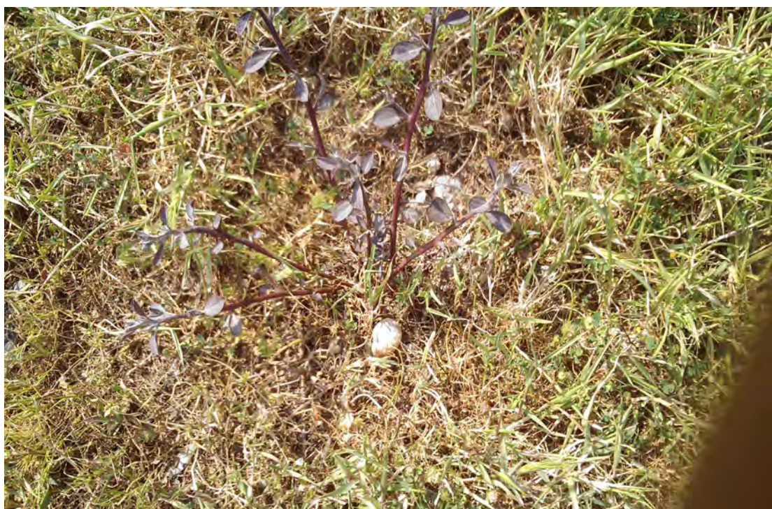
Capparis spinosa. (Πρωτότυπη εικόνα)

Η κάππαρη είναι θάμνος με βλαστούς μήκους 1 μέτρου, ανιόντες, εντελώς λείους, ενίοτε έρποντες. Τα φύλλα είναι εύπτωτα, ακέραια, λεία ή λίγο χνουδωτά με αγκάθια αγκιστρωτά και τα άνθη είναι μεγάλα, μονήρη, λευκά ή ασθενώς ιώδη. Η άνθιση γίνεται από το Μάιο έως το Σεπτέμβριο.