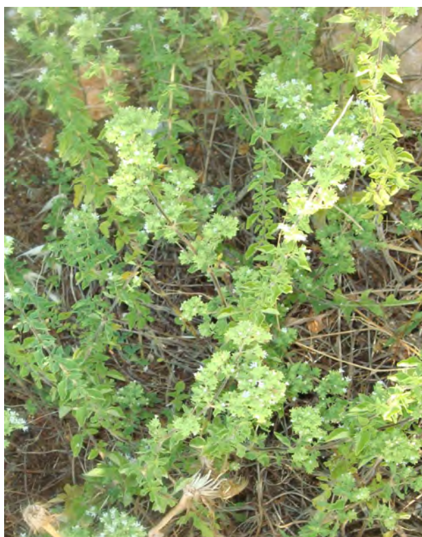
Origanum vulgare (Πρωτότυπη εικόνα)