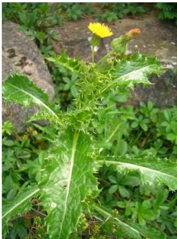
Sonchus asper . Ροζέτα

Είναι πόα μονοετής με βλαστό όμοιο με το λαχανώδη τσόχο. Τα φύλλα του είναι προμήκη, κυματιστά, οδοντωτά, πτερόβολα, ισχυρώς ακανθώδη και τα άνθη του είναι κίτρινα. Η άνθιση γίνεται από το Μάρτιο έως τον Ιούνιο.