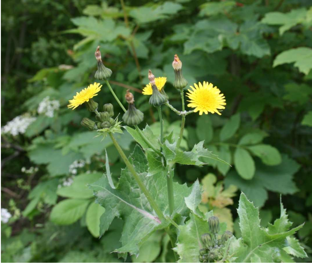
Sonchus oleracens . Βλαστός με άνθη