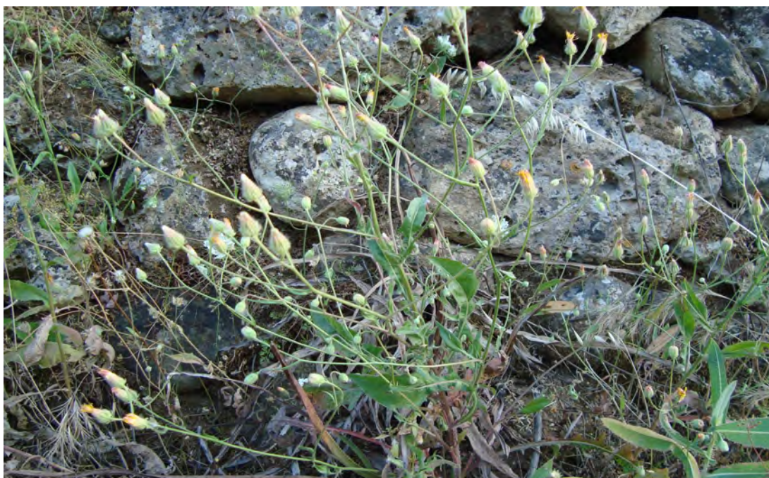
Crepis commutata . Βλαστοί με άνθη (Πρωτότυπη εικόνα)