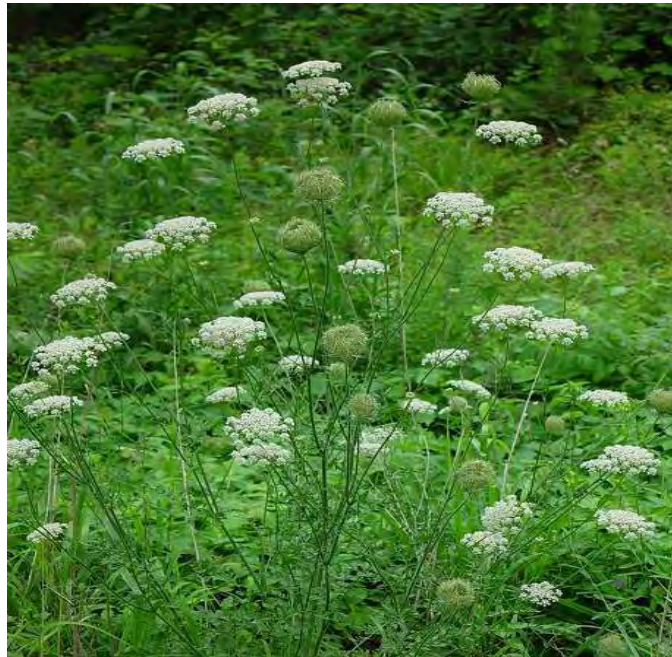
Daucus carota . Βλαστοί με άνθος (Πρωτότυπη εικόνα)