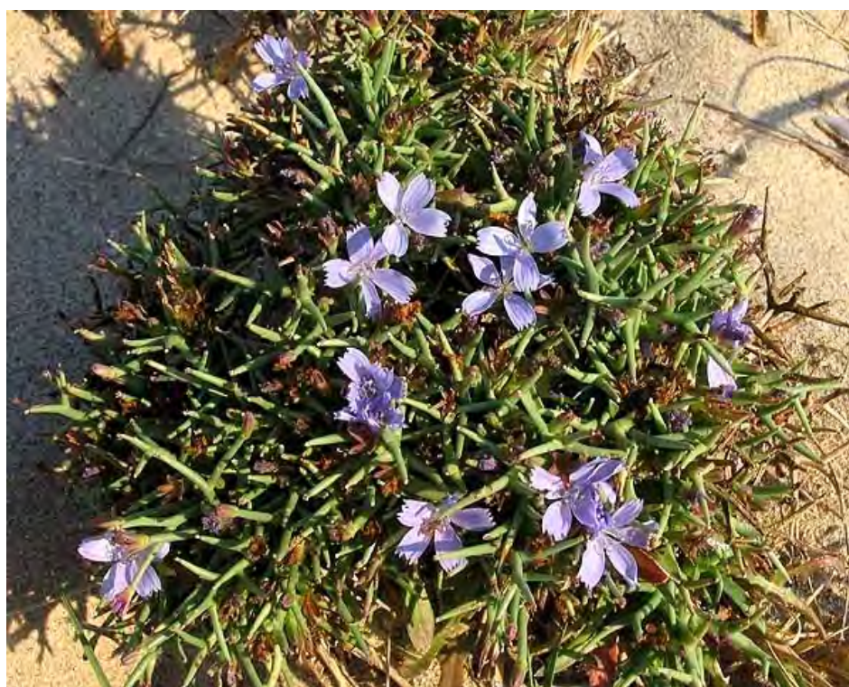
Cichorium spinosum . Βλαστός με άνθη (Πρωτότυπη εικόνα)