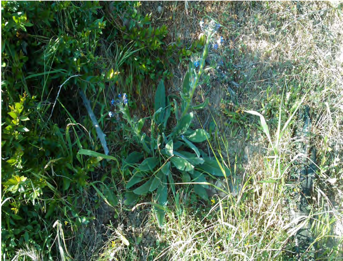
Anchusa azurea . Βλαστός (Πρωτότυπη εικόνα)