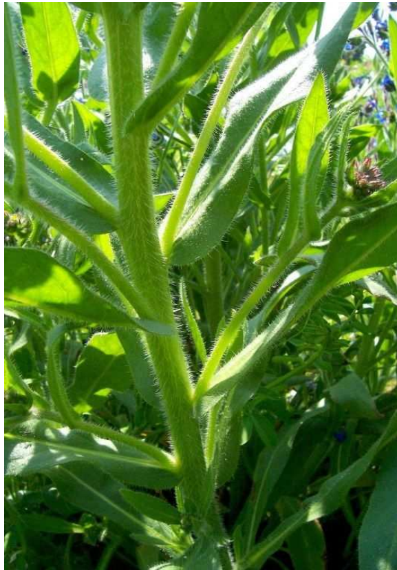
Anchusa azurea . Ροζέτα ( http://luirig.altervista.org )

Είναι πόα πολυετής με βλαστό όρθιο τριχωτό, τα φύλλα είναι λογχοειδή και τα άνθη χρώματος μπλε. Η άνθισή του γίνεται από τον Απρίλιο έως το Μάιο.