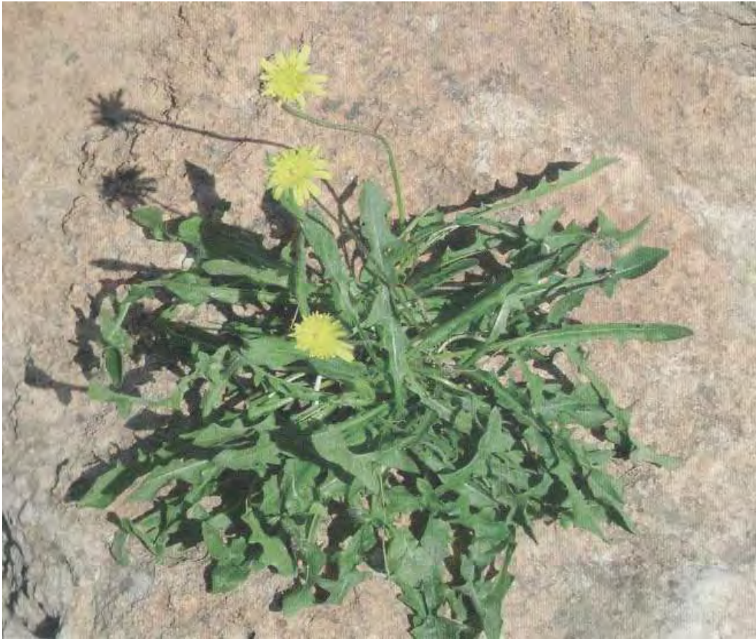
Leontodon tuberosus . Βλαστός με άνθη (Σταυριδάκης, 2006)