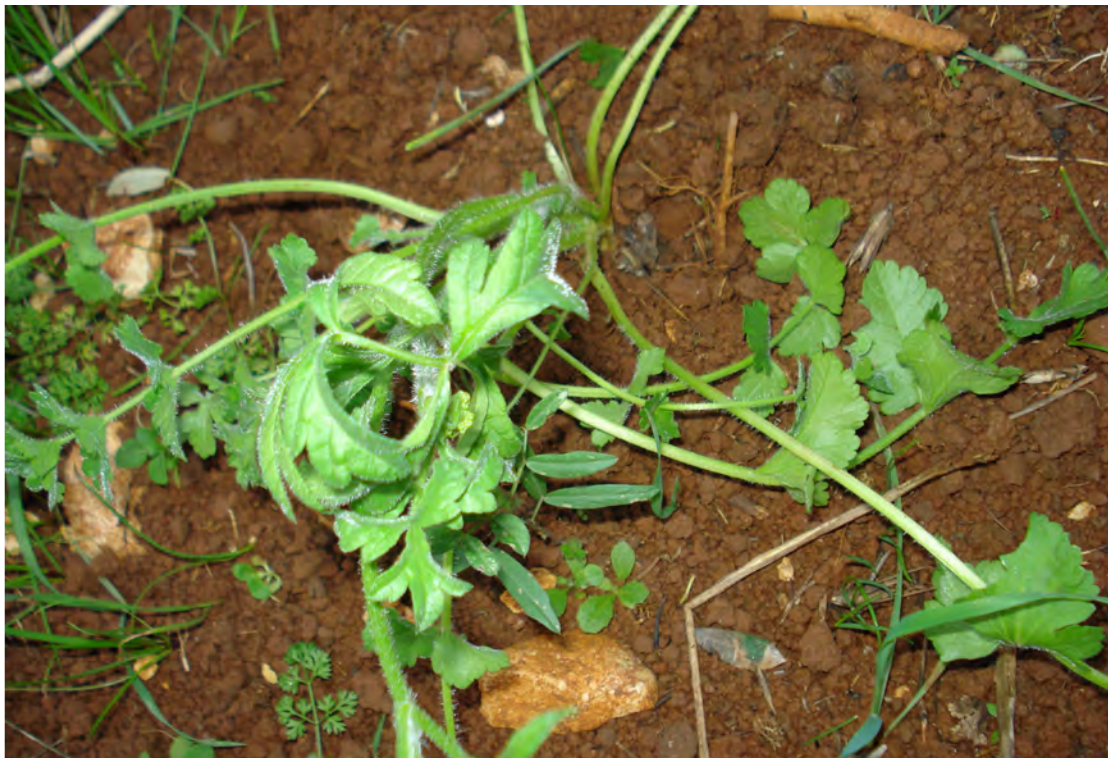
Tordylium arulum . Ροζέτα (Πρωτότυπη εικόνα)

Είναι πόα μονοετής, αρωματική με βλαστό τριχωτό, αυλακωτό κατά μήκος. Τα φύλλα είναι τριχωτά, τα κατώτερα πτεροσχιδή, βαθέως οδοντωτά, τα ανώτερα γραμμοειδή, σφηνοειδή και τα άνθη είναι λευκά. Η άνθιση γίνεται από τον Απρίλιο έως το Μάιο.