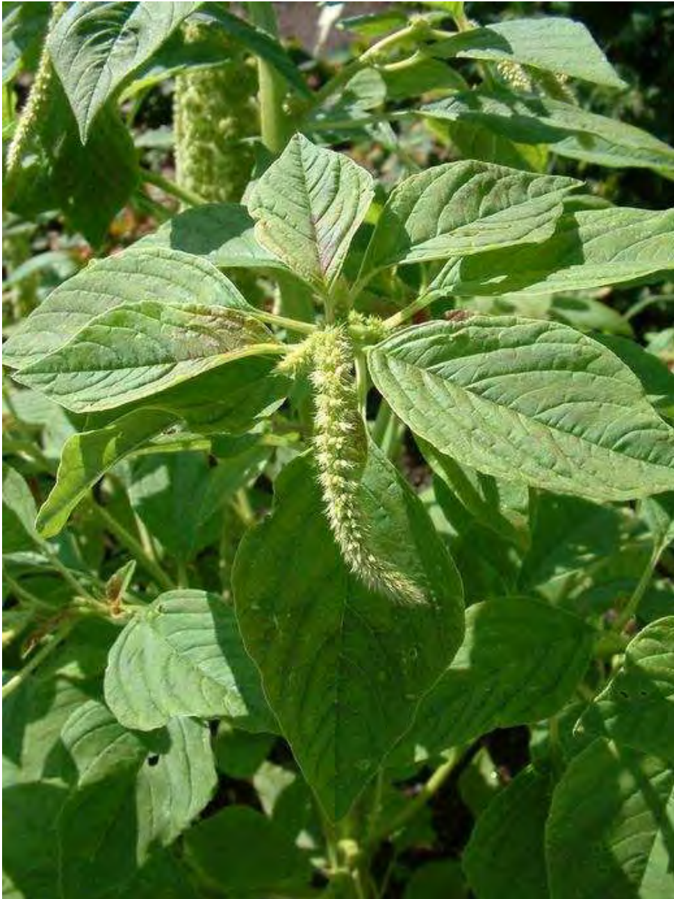
Amaranthus sp. Βλαστός (Πρωτότυπη εικόνα)