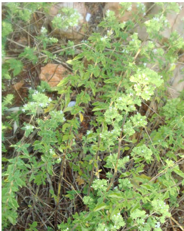
Origanum vulgare (Πρωτότυπη εικόνα)