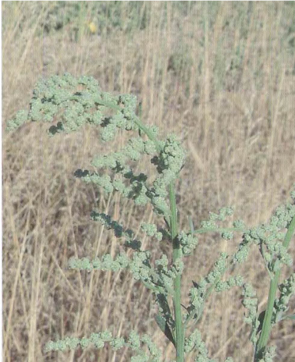
Chenopodium album . Βλαστός (Σταυριδάκης, 2006)