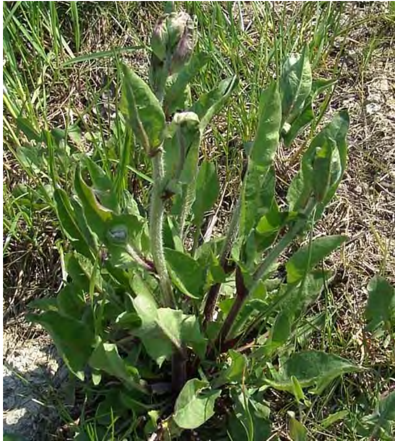
Crepis vesicaria . Βλαστός (Πρωτότυπη εικόνα)