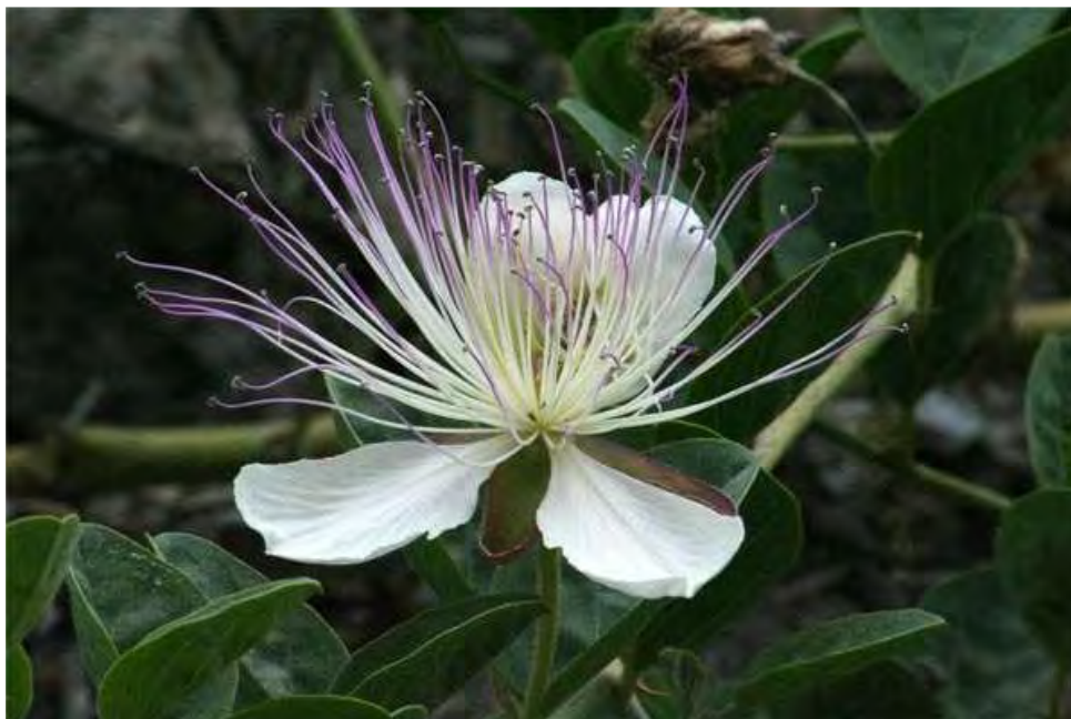
Capparis spinosa . Άνθος ( http://www.murciaregion.net/trevi/agrupacion_blanca.htm )