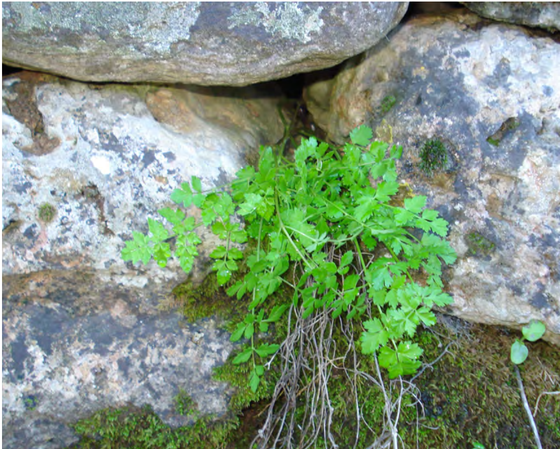
Scaligeria napiformis . Ροζέτα (Πρωτότυπη εικόνα)

Είναι πόα με βλαστό όρθιο, κυλινδρικό, λείο, διακλαδισμένο. Τα φύλλα είναι πτεροσχιδή, ρομβοειδή και τα άνθη είναι κιτρινόλευκα. Η άνθιση γίνεται από τον Απρίλιο έως το Μάιο.