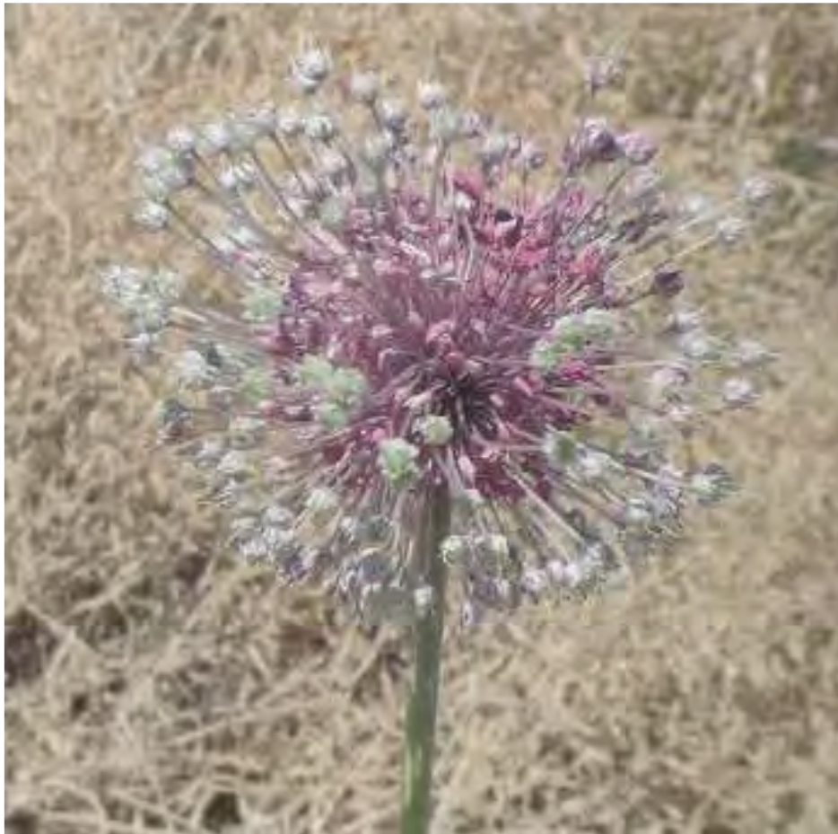
Allium ampeloprasum . Άνθος (Σταυριδάκης, 2006)

χρησιμοποιηθεί ως μυρωδικό με πολλά είδη χόρτων. (Προφορική μαρτυρία)