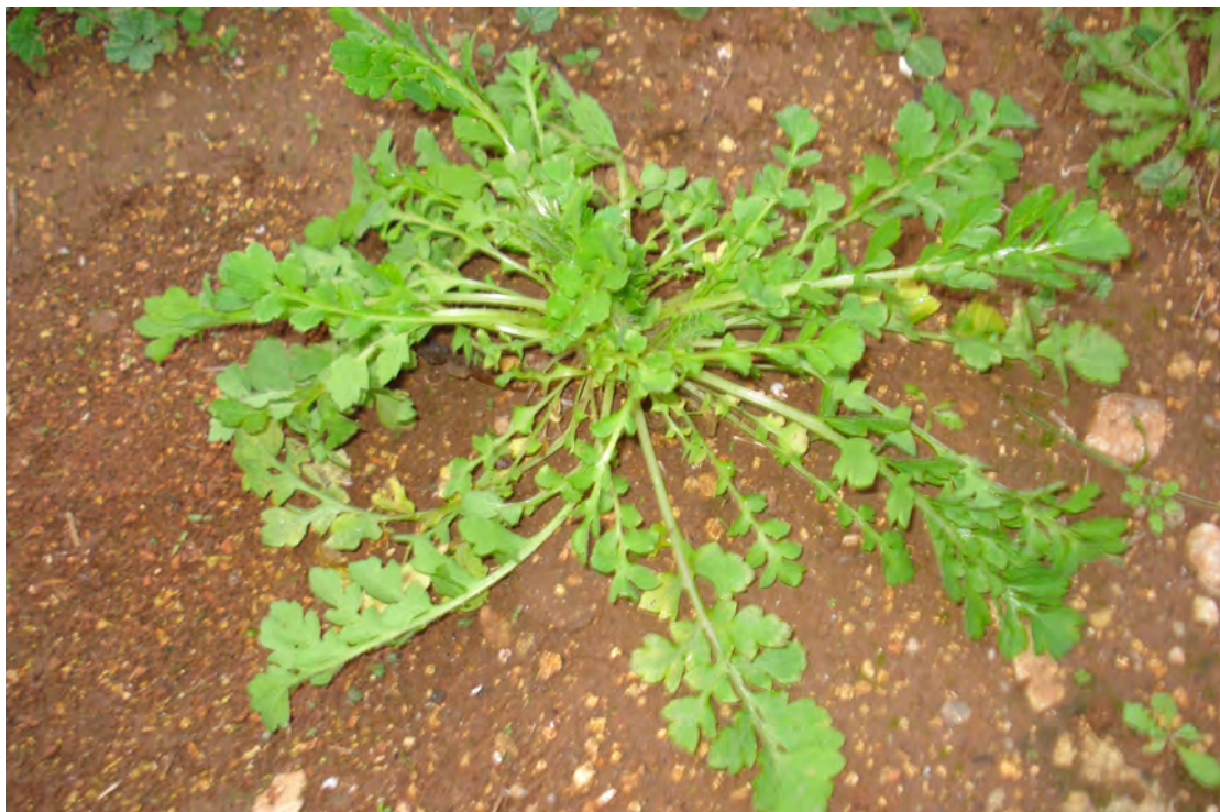
Papaver rhoeas. Ροζέτα (Πρωτότυπη εικόνα)

Είναι πόα μονοετής με βλαστό τριχωτό, όρθιο, πολύκλαδο. Τα φύλλα της είναι πτεροσχιδή με τμήματα λογχοειδή, οξέα, βαθέως οδοντωτά και τα του βλαστού επιφυή. Τα άνθη της είναι ζωηρά κόκκινα με μια μαύρη κηλίδα στη βάση. Η άνθιση γίνεται από το Μάρτιο έως το Μάιο.