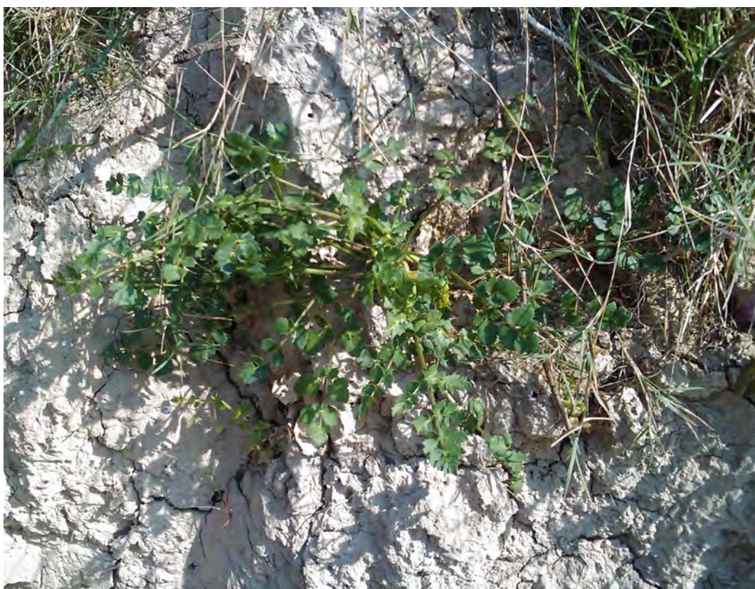
Kudmania sicula . Ροζέτα (Πρωτότυπη εικόνα)

Είναι πόα πολυετής με βλαστό χνουδωτό, στη βάση γραμμωτό, όρθιο με αραιές διακλαδώσεις. Τα φύλλα του είναι πτερωτά με φυλλάρια αντίθετα, πλατιά ωοειδή ή λογχοειδή πριονωτά και τα άνθη του είναι λευκοκιτρινωπά. Ο καρπός είναι κυλινδρικός, επιμήκης, λείος. Η άνθιση γίνεται από το Μάιο έως τον Ιούνιο.