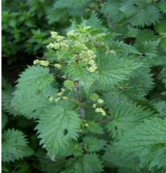
Urtica pilulifera . Άνθιση (Πρωτότυπη εικόνα)

Τέλος, θεραπεύει πόνους ρευματισμού, αν τη χτυπήσεις στο σημείο του πόνου. Βέβαια, αν ακουμπήσει το δέρμα, προκαλεί φαγούρα και πολύ έντονο τσούξιμο, απ' όπου πήρε το όνομα της