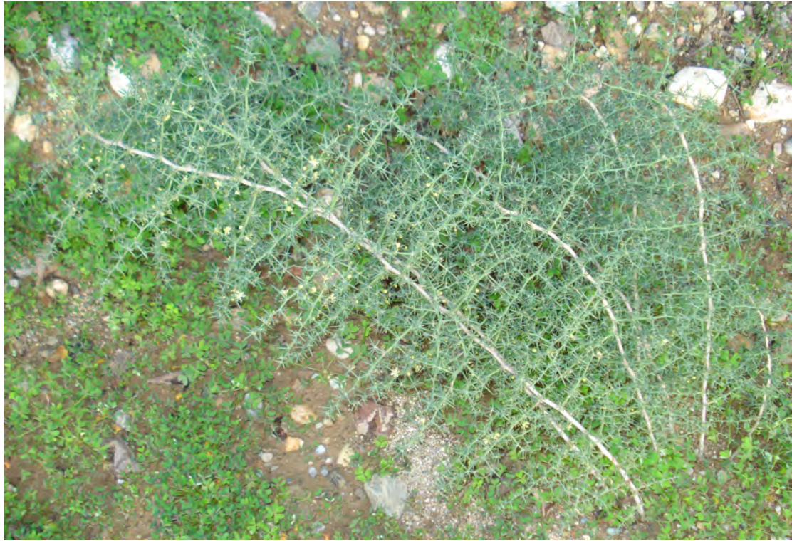
Asparagus arhyllus . Βλαστός (Πρωτότυπη εικόνα)