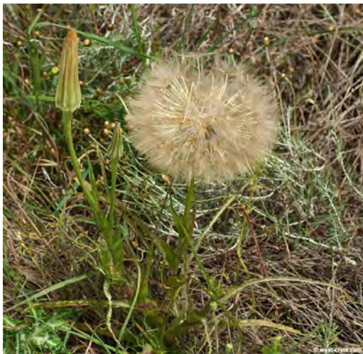
Tragopogon sinuatus. Ξεπούλιασμα άνθους (Πρωτότυπη εικόνα)

( http://www.west-crete.com/flowers/tragopogon_sinuatus.htm )