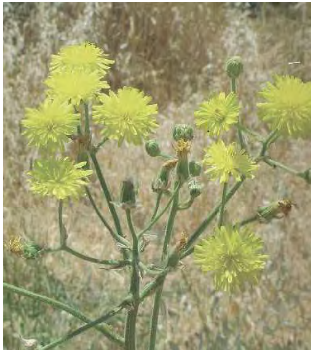
Crepis vesicaria . Άνθη (Πρωτότυπη εικόνα)