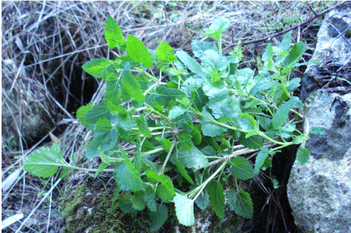
Paspium majus . Βλαστός (Πρωτότυπη εικόνα)