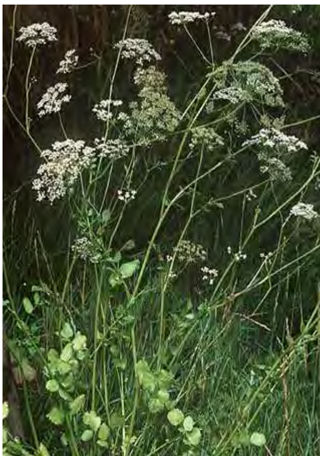
Pimpinella peregrina . Βλαστός με άνθη ( http://rips-uis.lubw.baden-wuerttemberg.de )