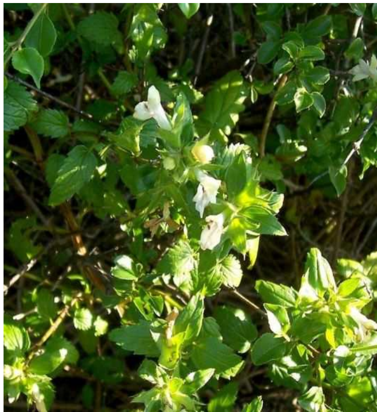
Paspium majus . Άνθος (Πρωτότυπη εικόνα)