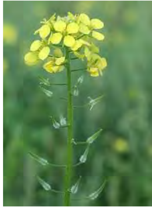
Sinapis alba . Ανθός