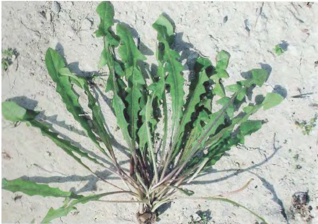
Leontodon tuberosus . Ροζέτα (Σταυριδάκης, 2006)

Είναι πόα πολυετής με ρίζες κονδυλώδεις, γαλακτοφόρες. Τα φύλλα είναι πτερόλοβα, οδοντωτά και τα άνθη είναι κίτρινα. Η άνθιση γίνεται από τον Οκτώβριο έως τον Απρίλιο.