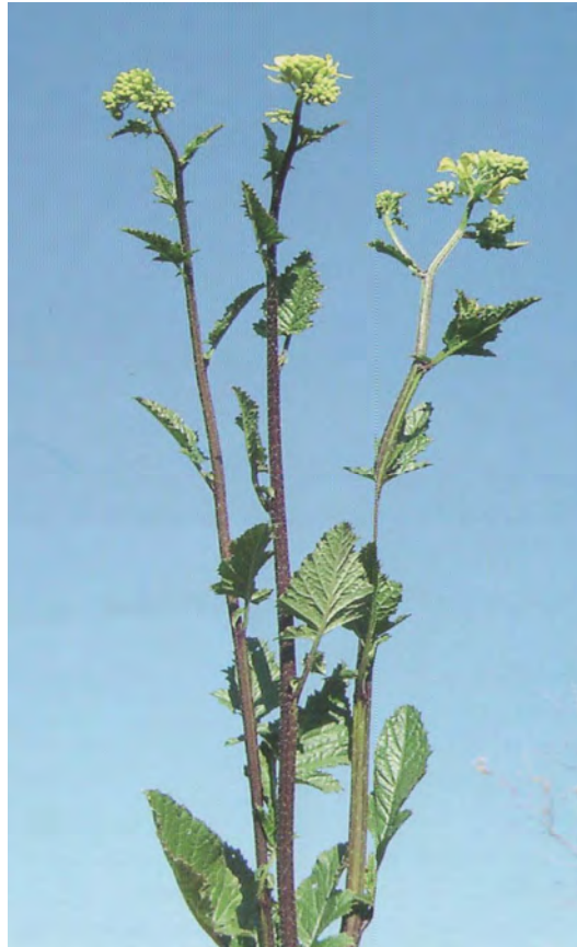
Hirschfeldia incana . Βλαστός (Σταυριδάκης, 2006)