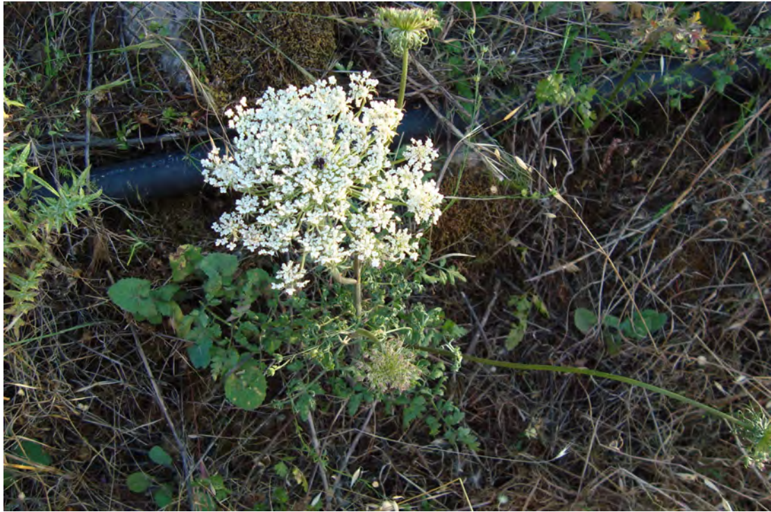
Daucus carota . Άνθος (Πρωτότυπη εικόνα)