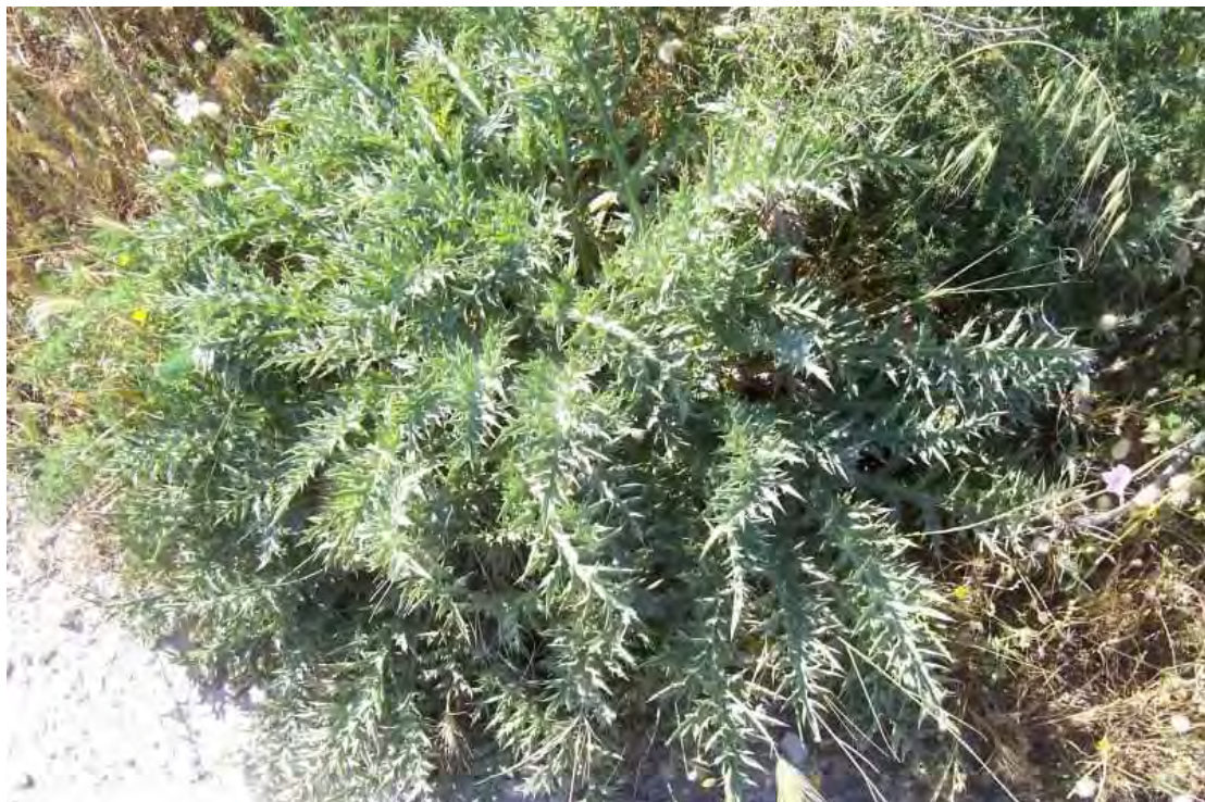
Atractylis gummifera . Ροζέτα (Πρωτότυπη εικόνα)

Είναι φυτό πολυετές, τα φύλλα του είναι λογχοειδή, βαθέως πτεροσχιδή ή πτερωτά με τμήματα ισχυρώς ακανθωτά και εφαπτόμενα σχεδόν του εδάφους. Τα άνθη είναι κεφάλια επιφυή, χρώματος ρόδινου με εξωτερικά περιβληματικά φύλλα γραμμοειδή, λογχοειδή, πτεροειδή, αγκαθωτά. Η άνθισή της γίνεται από τον Ιούνιο έως τον Αύγουστο.