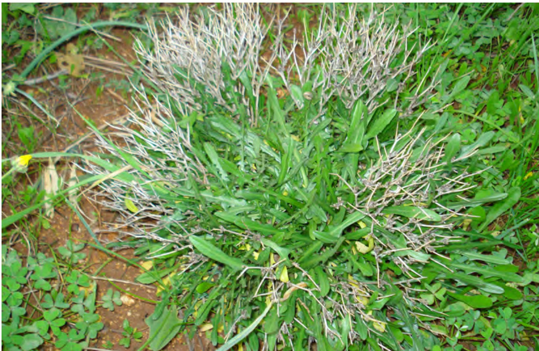
Cichorium spinosum. Ροζέτα (Πρωτότυπη εικόνα)

Είναι πόα πολυετής με κοντούς βλαστούς, αγκαθωτούς και διακλαδισμένους από τη βάση. Τα φύλλα είναι πτερόβολα ή οδοντωτά και το άνθος έχει χρώμα μπλε. Η άνθισή της γίνεται από το Μάιο έως τον Ιούνιο.