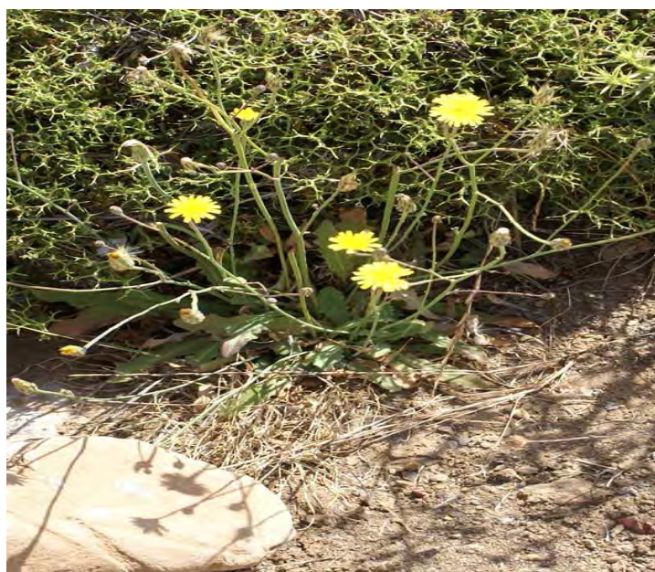
Crepis commutata . Βλαστοί με άνθη (Πρωτότυπη εικόνα)