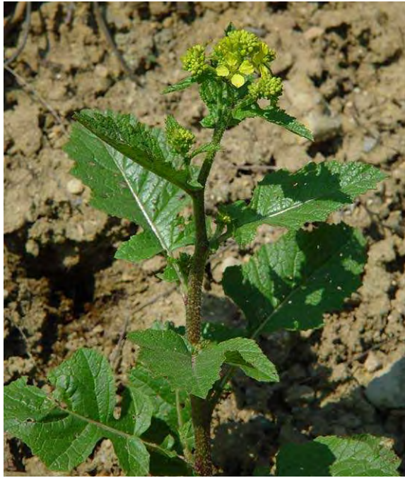
Sinapis alba . Βλαστός