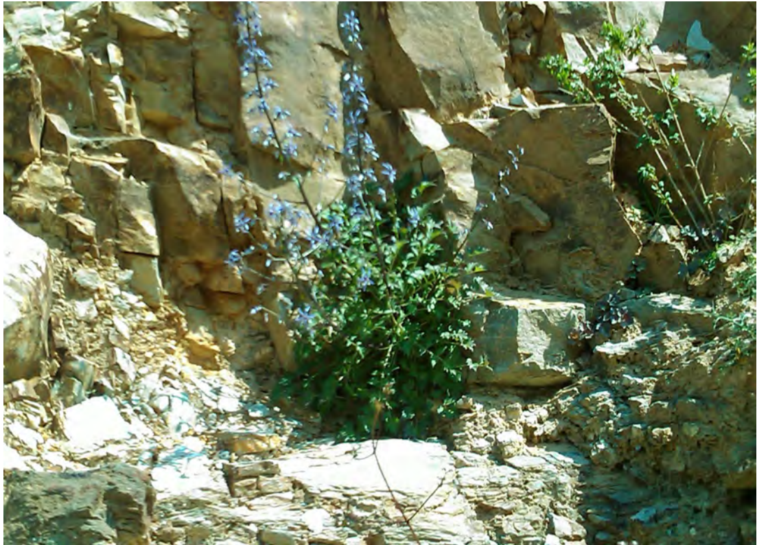
Petromarula pinnata . Βλαστός με άνθη (Πρωτότυπη εικόνα)