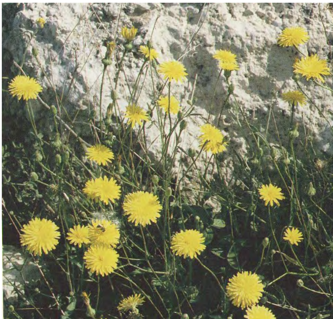
Reihardia picroides . Άνθη (Πρωτότυπη εικόνα)