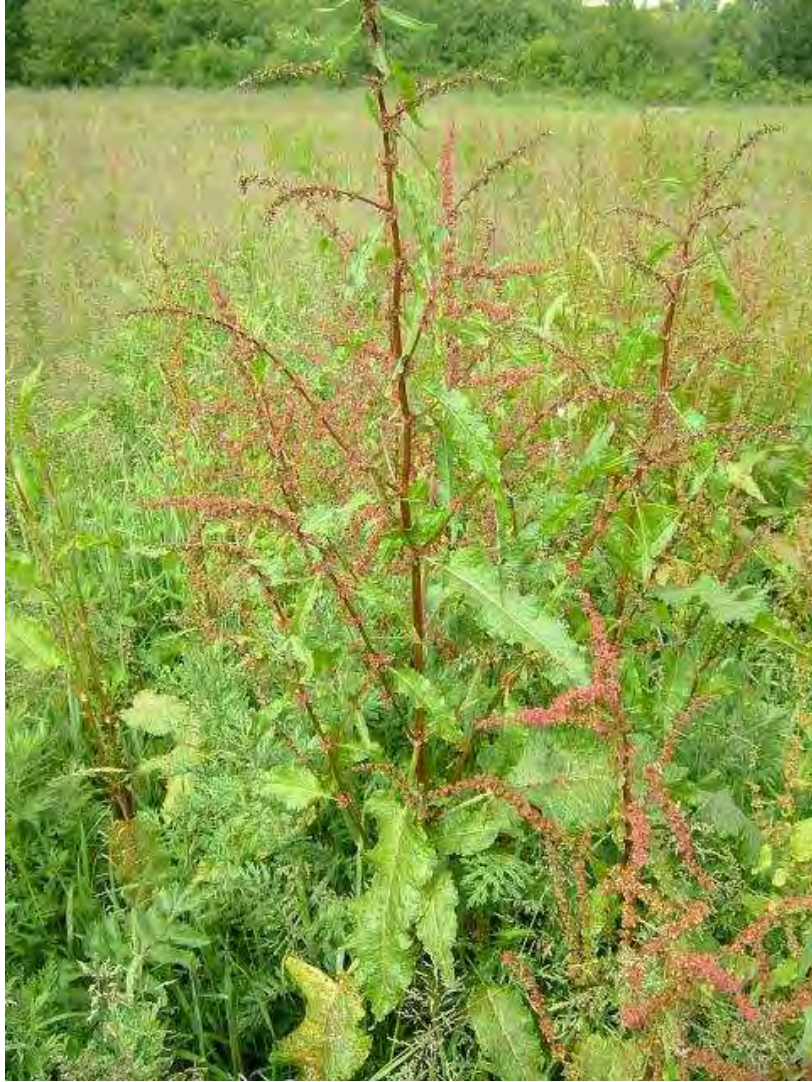
Rumex spp. Βλαστός (Πρωτότυπη εικόνα)