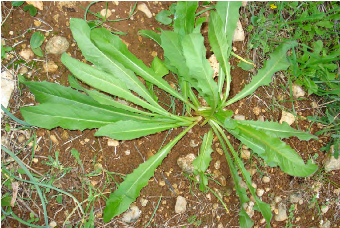
Cichorium intybus . Ροζέτα (Πρωτότυπη εικόνα)