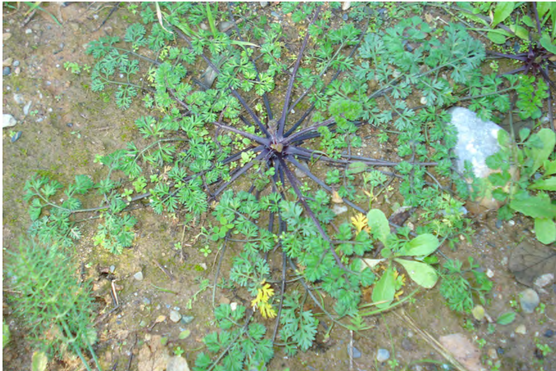
Daucus carota . Ροζέτα (Πρωτότυπη εικόνα)

Είναι πόα διετής με βλαστούς όρθιους, με διακλαδώσεις. Τα φύλλα του είναι μαλακά, προμήκη, πτερωτά και τα άνθη του είναι λευκά ή ρόδινα. Η άνθιση γίνεται από τον Απρίλιο έως το Μάιο.