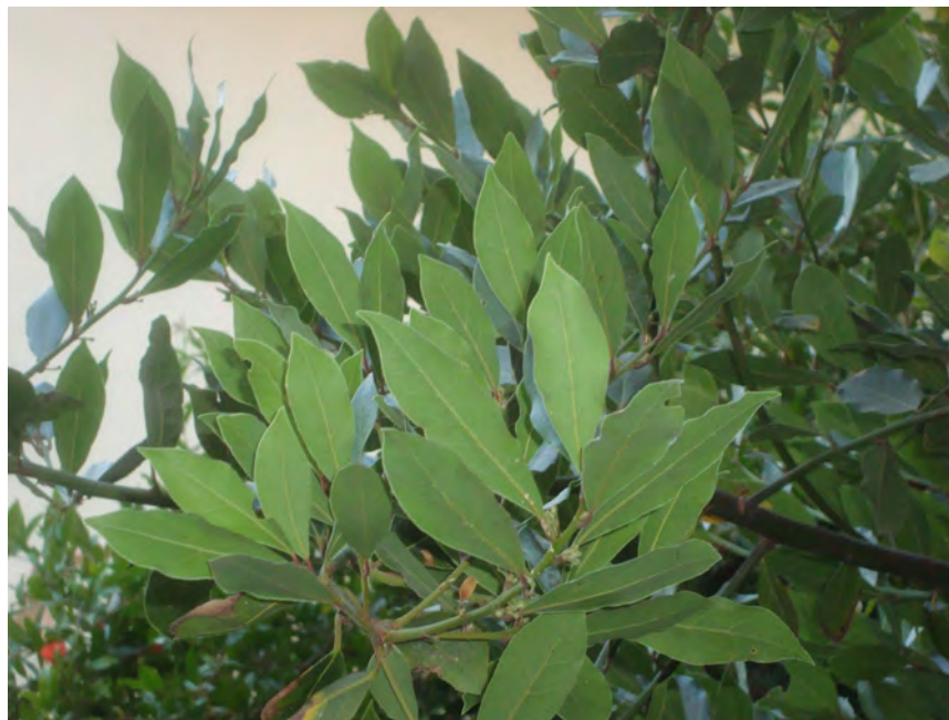
Laurus nobilis βλαστός (Πρωτότυπη εικόνα)