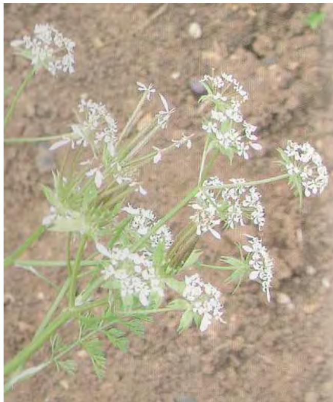
Scandix pecten veneris . Βλαστός (Σταυριδάκης, 2006)