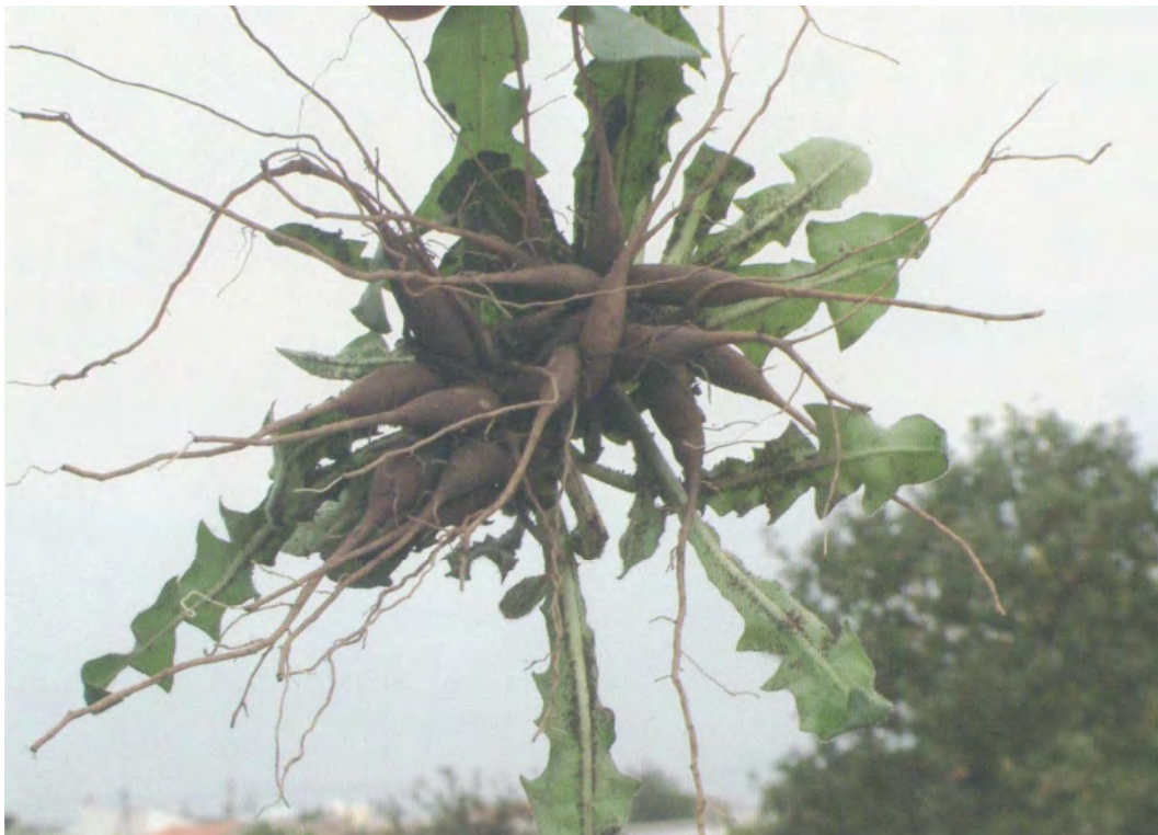
Leontodon tuberosus . Ρίζα (Σταυριδάκης, 2006)