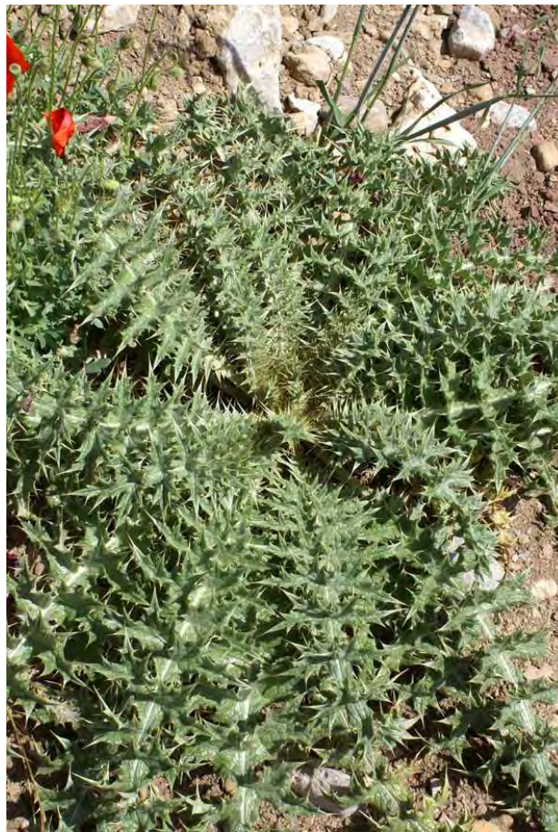
Cynara cornigera . Ροζέτα (Πρωτότυπη εικόνα)

Είναι πόα πολυετής με βλαστό όρθιο, εύρωστο. Τα φύλλα είναι σε διάταξη ρόδακα, βαθιά λοβωτά με ανοιχτόχρωμες νευρώσεις στην επάνω επιφάνεια. Έχει κεφάλια με ανθίδια σωληνοειδή, κιτρινωπά. Η άνθισή της γίνεται από το Μάρτιο έως το Μάιο.