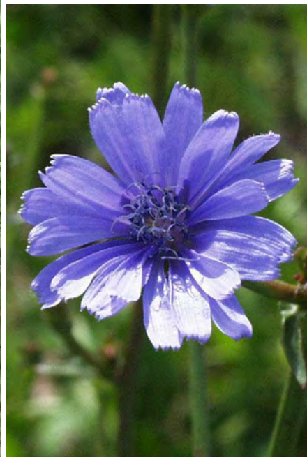
Cichorium intybus . Άνθος