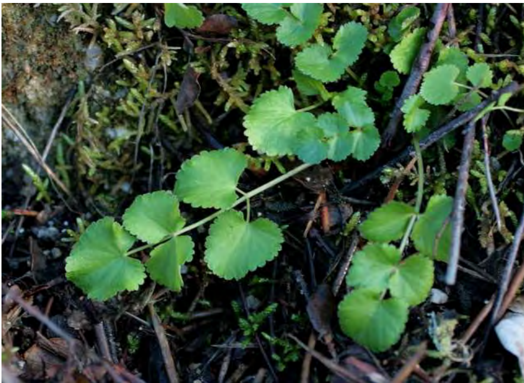
Pimpinella peregrina . Ροζέτα (Πρωτότυπη εικόνα)

Είναι πόα διετής με βλαστό γραμμωτό κατά μήκος, μέχρι 1 μέτρο ύψος, διακλαδισμένο, έμφυλλο. Τα κατώτερα φύλλα είναι πτεροσχιδή με φυλλάρια καρδιοειδή, οδοντωτά, τα μεσαία είναι σφηνοειδή, οδοντωτά και τα ανώτερα φύλλα είναι γραμμοειδή. Τα άνθη είναι λευκά και ο καρπός με τρίχα όρθια. Η άνθιση γίνεται από τον Απρίλιο έως το Μάιο.