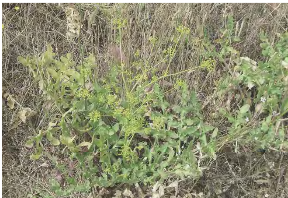
Oenothera pimpineloides . Βλαστός (Πρωτότυπη εικόνα)

Είναι πόα πολυετής, απλωτή. Τα φύλλα της βάσης είναι πτεροσχιδή με φυλλάρια σφηνοειδή ή ωοειδή, τα φύλλα του βλαστού είναι πτεροσχιδή με φυλλάρια γραμμοειδή και τα άνθη είναι κίτρινα. Η άνθιση γίνεται από το Μάιο έως τον Ιούνιο.