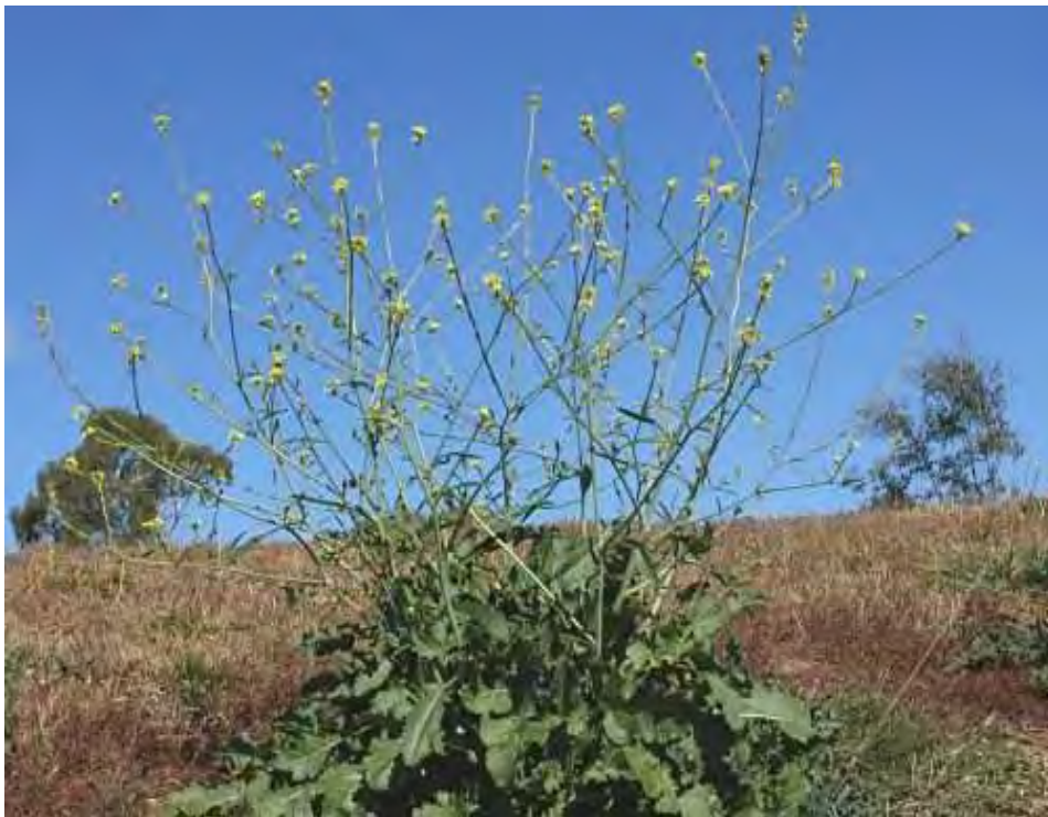
Hirschfeldia incana . Βλαστός και άνθη