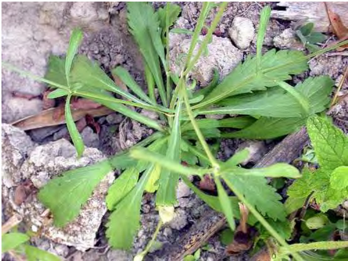
Scariosa atropurpurea . Ροζέτα (Πρωτότυπη εικόνα)

Είναι πόα μονοετής με βλαστό όρθιο, διακλαδιζόμενο. Τα φύλλα είναι αντίθετα, τα κατώτερα προμήκη, ρομβοειδή και τα ανώτερα λοβωτά, πτερόβολα. Έχει κεφάλια με ανθίδια σε χρώμα λιλά και λευκό. Η άνθιση γίνεται από τον Ιούνιο έως το Σεπτέμβριο.