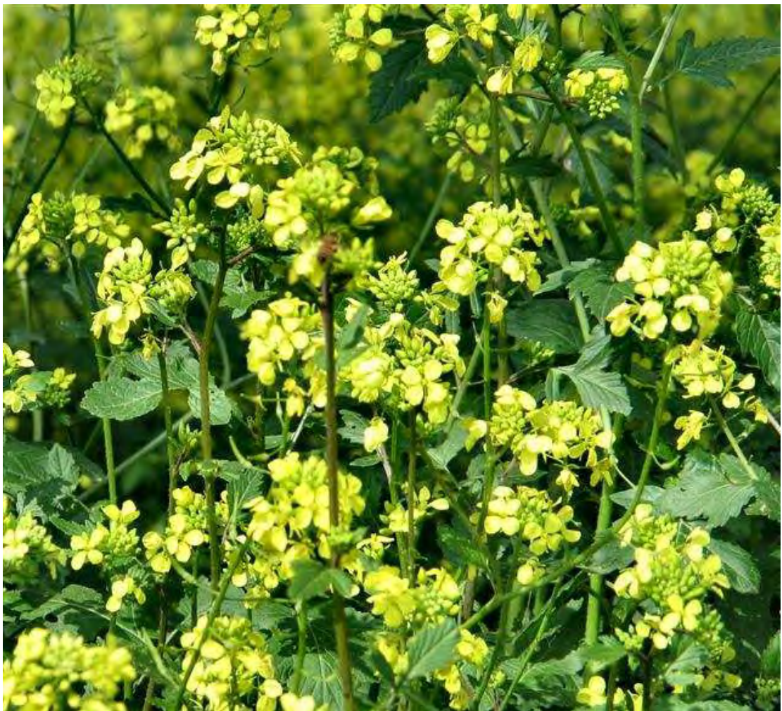
Sinapis alba . Ανθη