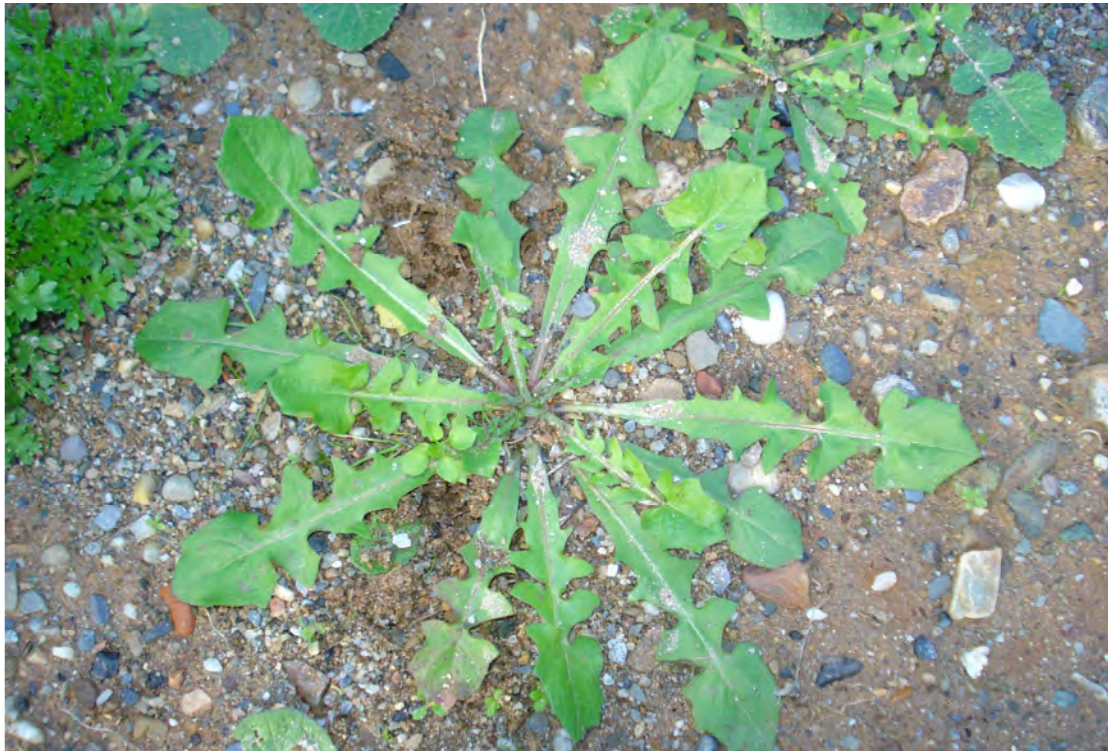
Crepis commutata . Ροζέτα (Πρωτότυπη εικόνα)

Είναι πόα μονοετής με βλαστό λείο. Τα φύλλα της είναι λυροειδή και τα άνθη της είναι κίτρινα. Η άνθισή της γίνεται από τον Απρίλιο έως το Μάιο.