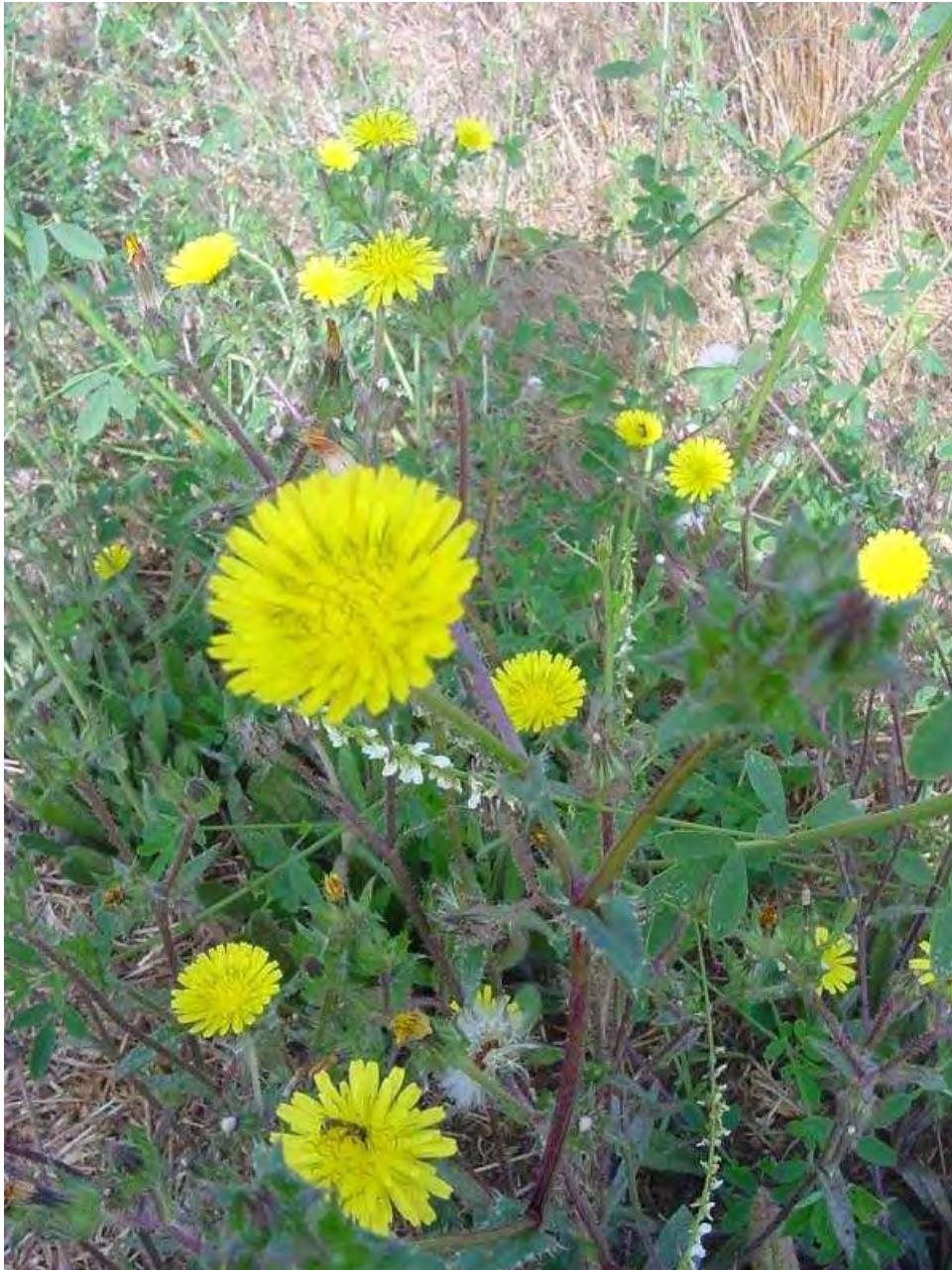
Helminthotheca echioides . Βλαστός με άνθη (Πρωτότυπη εικόνα)