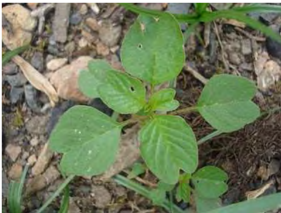
Amaranthus sp. Ροζέτα (Πρωτότυπη εικόνα)

Είναι πόα μονοετής, τα φύλλα είναι ωσειδή με λεία επιφάνεια και τα άνθη είναι πολύ μικρά, χρώματος κίτρινου. Η άνθισή τους γίνεται από τον Ιούλιο έως το Σεπτέμβριο.