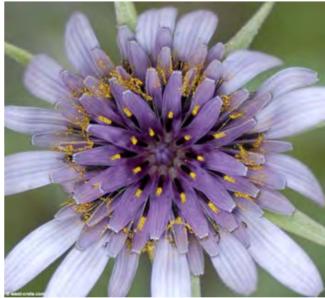
Tragopogon sinuatus. Άνθος

( http://www.west-crete.com/flowers/tragopogon_sinuatus.htm )