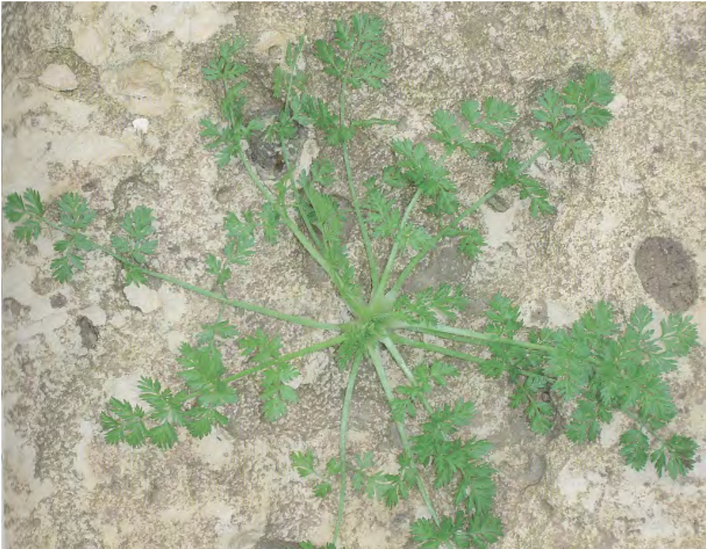
Scandix pecten veneris . Ροζέτα (Σταυριδάκης, 2006)