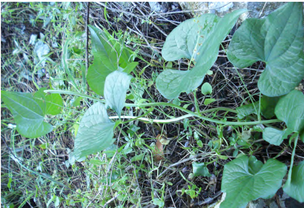
Tamus communis . Βλαστός (Πρωτότυπη εικόνα)

Είναι πόα πολυετής με βλαστούς αναρριχώμενους ύψους 1-3 μέτρων και ρίζωμα ατρακτοειδές, κονδυλώδες, μελανό εξωτερικά. Τα φύλλα της είναι ωοειδή, καρδιοειδή, οξύληκτα, διαφανή με νευρώσεις, τα άνθη είναι πρασινοκίτρινα και ο καρπός είναι ωοειδή, κόκκινος, γυαλιστερός. Η άνθισή της γίνεται από τον Απρίλιο έως το Μάιο.