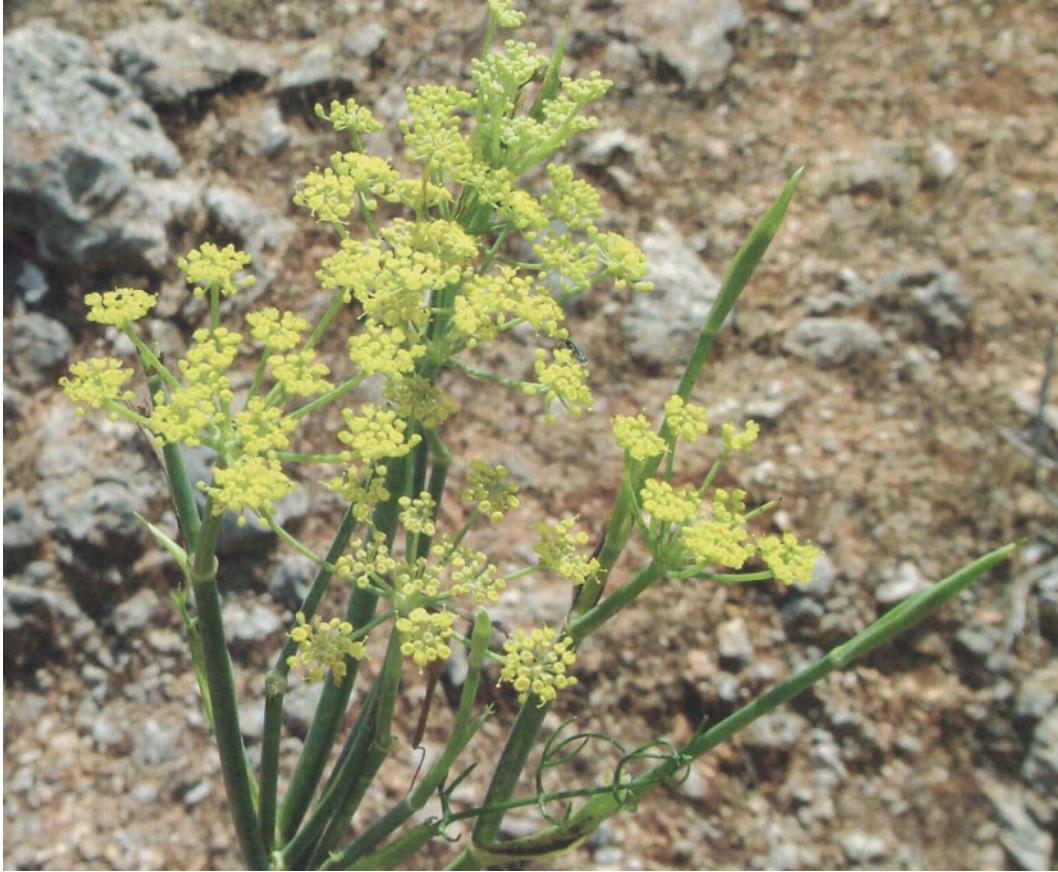
Foeniculum vulgare . Βλαστός με άνθος (Σταυριδάκης, 2006)