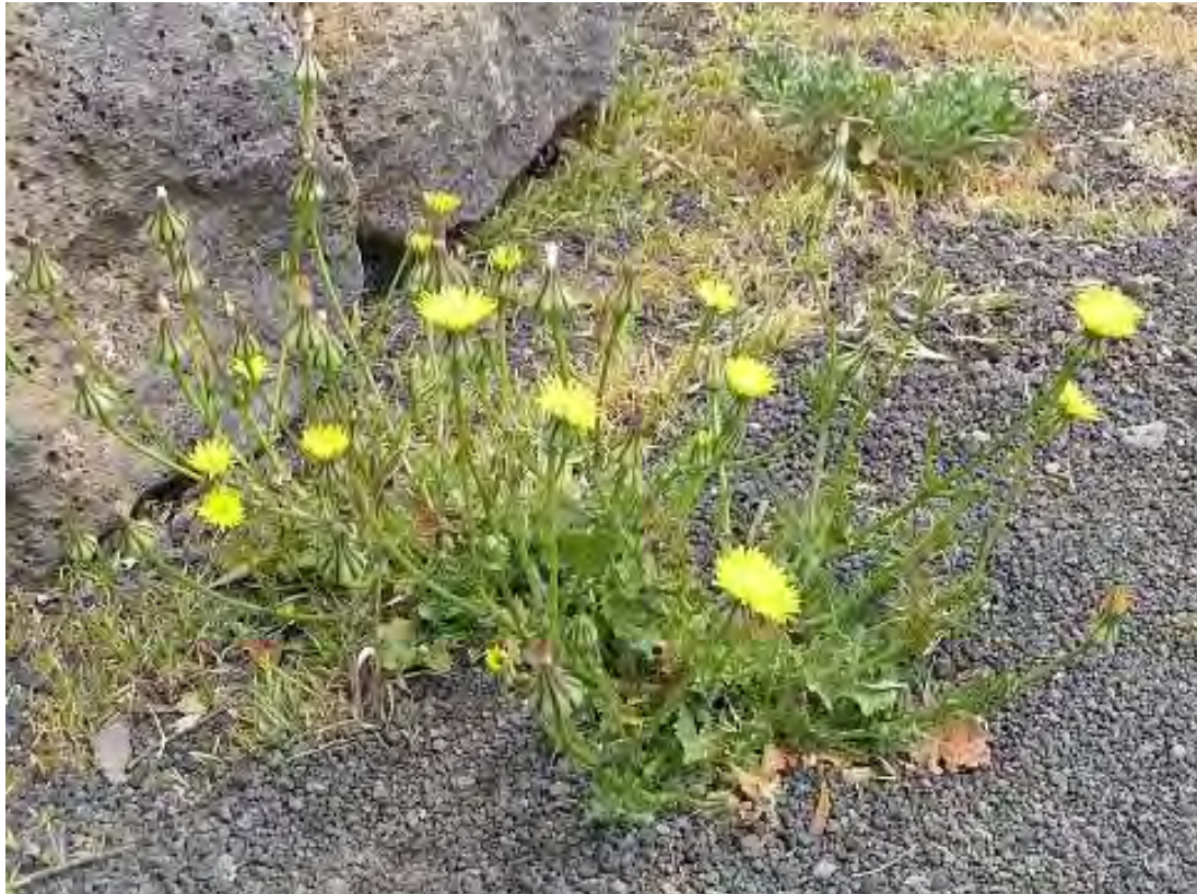
Urospermum picroides. Άνθη