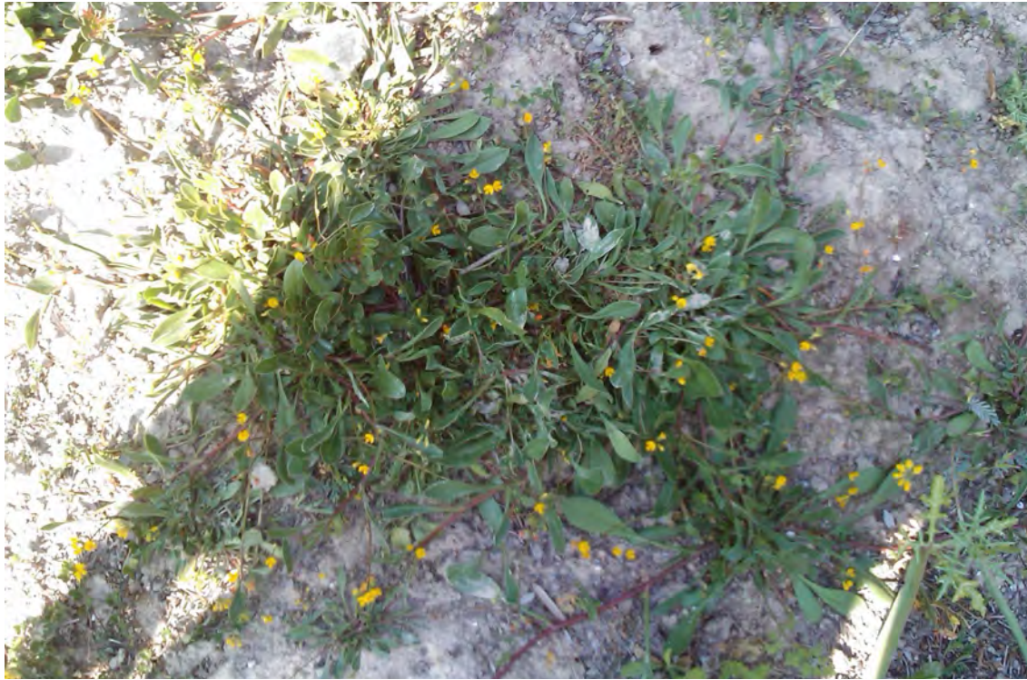
Scorpiurus muricatus . Βλαστός με ανθάκια (Πρωτότυπη εικόνα)