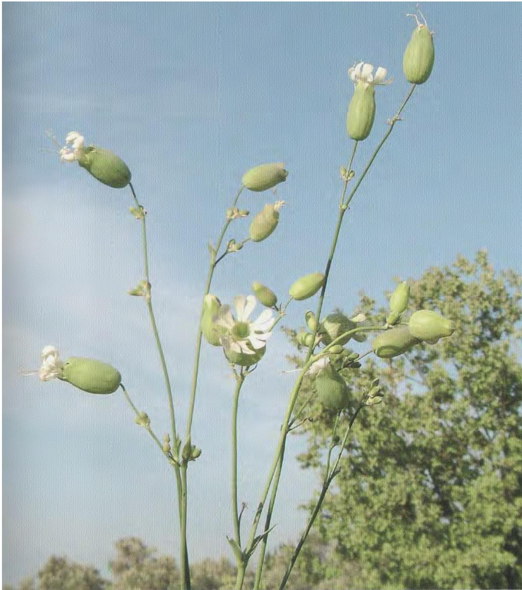
Silene vulgaris . Βλαστός με ανθήκια (Σταυριδάκης, 2006)

το βλαστό με το άνθος του και το βάζουν σε ανθοδοχείο ως διακοσμητικό. (Προφορική μαρτυρία)