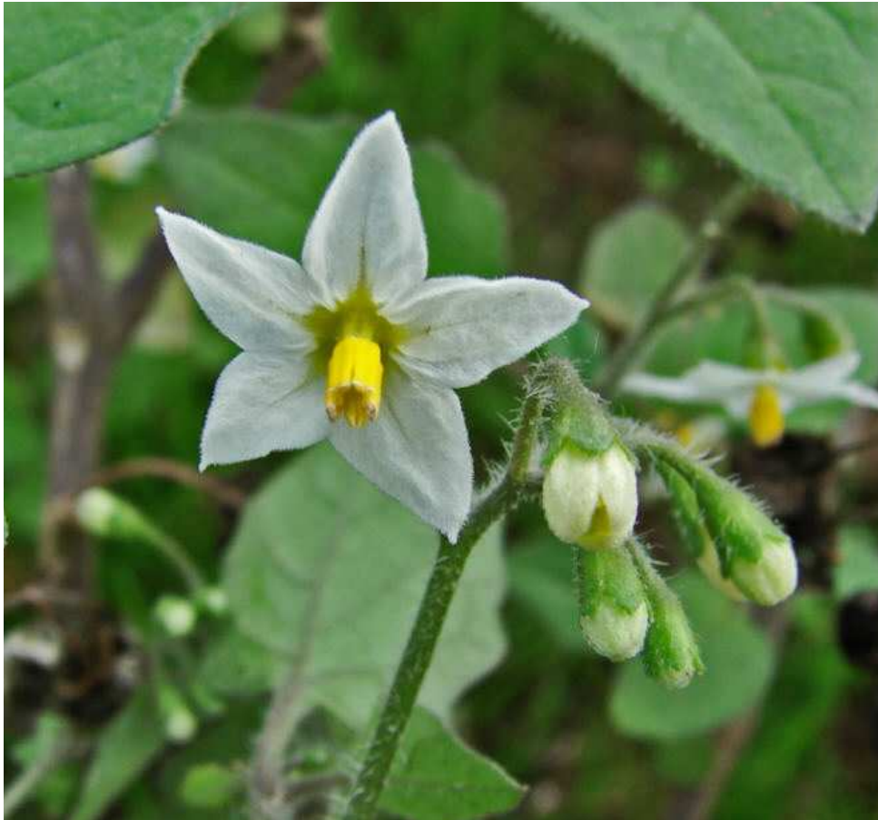
Solanum nigrum . Βλαστός με άνθη ( http://www.naturspaziergang.de/Pflanzen/Solanum_nigrum.htm )